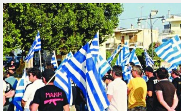
Συγκέντρωση της Χρυσής Αυγής στη Σκάλα Λακωνίας

Στο μυαλό του κ. Μπαλτάκου, όπως και του κ. Κασιδιάρη, η λέξη «Μανιάτης» έχει πολιτική έννοια. Δεν είναι βέβαια κρυφό το γεγονός ότι οι