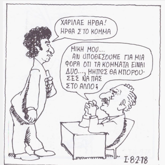
Σκίτσο του Γιάννη Ιωάννου στο ANTI

-Στις πρώτες μεταδικτατορικές εκλογές, το 1974 , η τηλεόραση τον παρουσιάζει να εκφωνεί λόγο ως υποψήφιος της Ενωμένης Αριστεράς στη Β' Πειραιώς. Ο ευφραδής Μίκης διαβάζει γραπτό κείμενο... Οι λεπτεπίλεπτες ισορροπίες του εκλογικού σχήματος, δεν σήκωναν νέες δοκιμασίες από ενδεχόμενες λεκτικές υπερβάσεις. Πρόσφατο ήταν το « Καραμανλής ή Τανκς ».