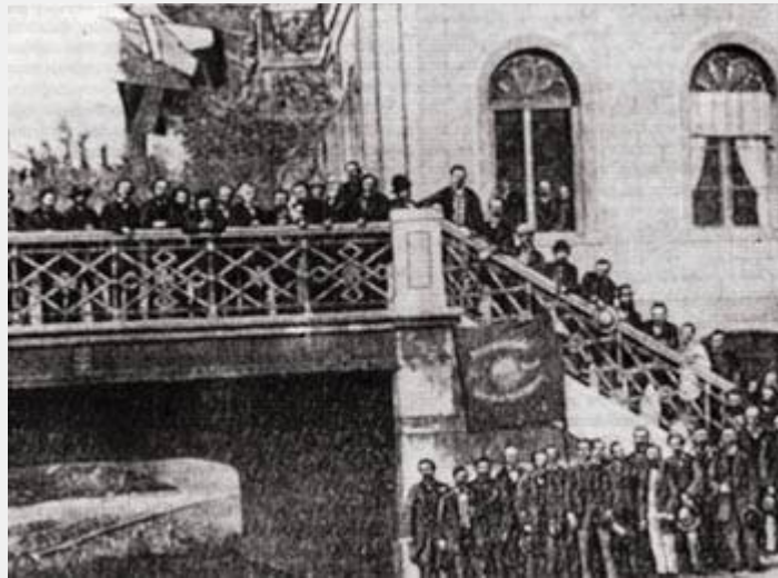
Αντιπρόσωποι του Συνεδρίου της 1ης Διεθνούς

Οι προσπάθειες να ιδρυθεί μια παγκόσμια προλεταριακή οργάνωση που έγιναν στην αρχή της δεκάετίας, καθρέφτιζαν την έντονη επιθυμία των πρωτοπόρων εργατών της Ευρώπης και της Αμερικής να ενωθούν σε παγκόσμια κλίμακα. Η επιθυμία αυτή φαίνεται πιο καθαρά στις εκδηλώσεις αλληλεγγύης που έδειξαν οι εργάτες στις διάφορες χώρες για την πολωνική εξέγερση, στα συλλαλητήρια των Αγγλων εργατών για να υποστηρίξουν τον αγώνα του αμερικανικού λαού εναντίον της δουλείας κλπ.