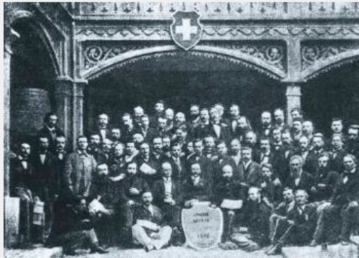
Οι αντιπρόσωποι της Α΄ Διεθνούς

Το προσωρινό καταστατικό της Ένωσης αρχίζει μ' ένα προοίμιο που θέτει στην οργάνωση το καθήκον να καθοδηγήσει την εργατική τάξη για την κοινωνική της απελευθέρωση ως εξής: «Η απελευθέρωση της εργατικής τάξης πρέπει να καταχτηθεί από την ίδια την εργατική τάξη.