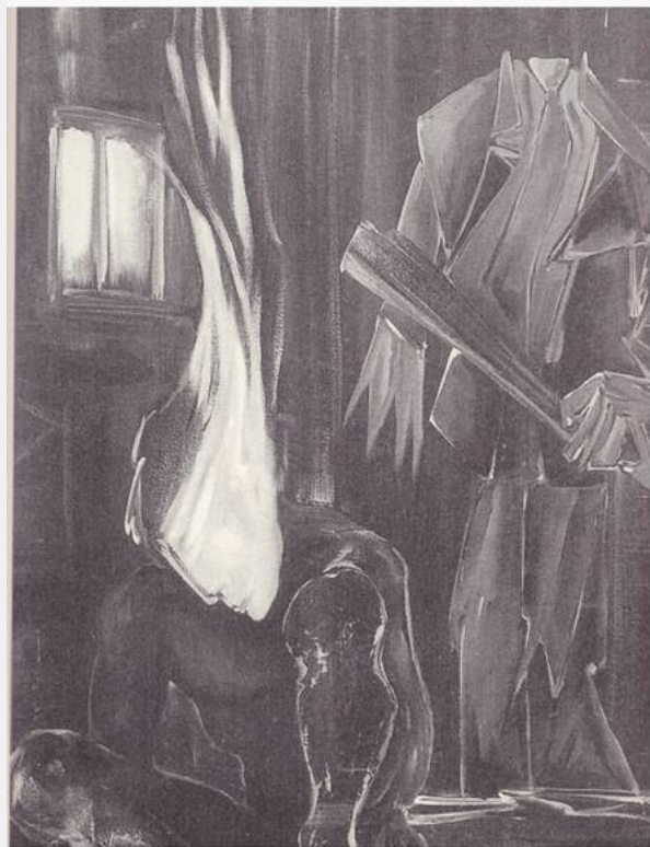
Έργο του Γιώργου Τσιριγώτη

Κι ακόμα μιλούσαν γι αυτόν στέρνες, πηγάδια και σχισμένοι βράχοι. Οι πέτρες των νησιών του Αιγαίου, νύχτες στοχαστικές κι η θάλασσα της Λέρου που ρυτίδιασε από τη φρίκη της