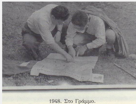
1948. Στο Γράμμο.

Εννοείται βέβαια ότι η κριτική είναι δασκάλα της εμπειρίας και της γνώσης, αρκεί να γίνεται δίχως εμπάθεια και ευτελείς προσωπικούς λόγους, αλλά με αίσθημα ιστορικής ευθύνης, με ανάλογο σεβασμό και περίσκεψη -έτσι όπως κάνουν οι άνθρωποι μέσα στην ίδια τους την οικογένεια-, για όσους πρωτοστάτησαν στη δημιουργία μιας μεγάλης ιστορικής εποχής, ανεβάζοντας το επίπεδο των λαϊκών αγώνων μέχρι την ένοπλη σύγκρουση με τους ξένους και ντόπιους δυνάστες κάθε μορφής. Αυτό, ακόμα κι από μόνο του, ήταν μια μεγάλη ηθική νίκη με τεράστια θετική επίδραση στις επόμενες γενιές - έστω κι αν δεν έφερε το αναμενόμενο στρατηγικό αποτέλεσμα.