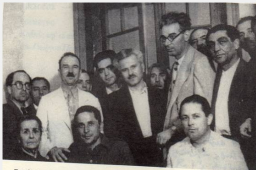
Τη μέρα της επιστροφής του Ν. Ζαχαριάδη από το Νταχάου (Μάης του 1945). Στην άκρη αριστερά η μητέρα του Ερατώ, πλάι της ο Ν. Ζαχαριάδης, στην άκρη δεξιά ο αδελφός του Μίμης. Ορθοί πίσω τους, από αριστερά, οι Λ. Στρίγκος, Γ. Σιάντος, Μ. Παρτοαλίδης, Μ. Πορφυρογένης και Κ. Γαβριηλίδης, ηγέτες του Αγροτικού Κόμματος Ελλάδας.