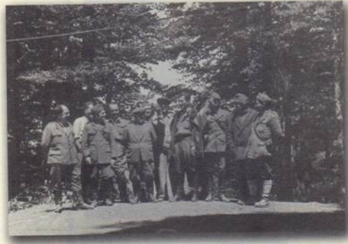
1948. Ηγεσία του Δημοκρατικού Στρατού Ελλάδος (Δ.Σ.Ε). Ν. Ζαχαριάδης, Μ. Βαφειάδης, Μ. Πορφυρογένης, Γ. Γούσιος, Α. Στρίγκος, Κ. Λουλής, Ι. Ιωαννίδης, και άλλα στελέχη.

Είχα μιλήσει μαζί του για τελευταία φορά το Μάρτη του 1962. Τότε το Νησί της Αφροδίτης παιζόταν σε 170 πόλεις της Σοβιετικής Ένωσης, κι εγώ ετοιμαζόμουν να κατέβω στην πατρίδα προσκαλεσμένος απ' το Κρατικό Θέατρο Βορείου Ελλάδος, που ανέβαζε το έργο μου με πρωταγωνίστρια την Κυβέλη. Την πρόσκληση, όπως και το αντίστοιχο συμβόλαιο για τ' ανέβασμα που "πρεπε να υπογράψω, την είχε φέρει ο τότε πρόεδρος του Διοικητικού Συμβουλίου του ΚΘΒΕ Γιώργος Θεοτοκάς (είχε έρθει συμπτωματικά στην ΕΣΣΔ ύστερα από επίσημη πρόσκληση της Ένωσης Σοβιετικών Συγγραφέων μαζί με τους Ελύτη και Εμπειρίκο).