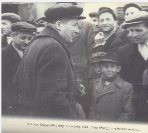
Ο Νίκος Ζαχαριάδης στην Τασκένδη, 1954. Τότε όλοι χαμογελούσαν ακόμη...

«Έχω κόψει κάθε σχέση με τη δοτή ηγεσία Κολιγιάννη», δυσφόρησα εγώ.