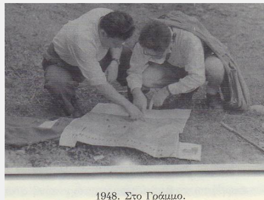
1948. Στο Γράμμο.

Εννοείται βέβαια ότι η κριτική είναι δασκάλα της εμπειρίας και της γνώσης, αρκεί να γίνεται δίχως εμπάθεια και ευτελείς προσωπικούς λόγους, αλλά με αίσθημα ιστορικής ευθύνης, με ανάλογο σεβασμό και περίσκεψη -έτσι όπως κάνουν οι άνθρωποι μέσα στην ίδια τους την οικογένεια-, για όσους πρωτοστάτησαν στη δημιουργία μιας μεγάλης ιστορικής εποχής, ανεβάζοντας το επίπεδο των λαϊκών αγώνων μέχρι την ένοπλη σύγκρουση με τους ξένους και ντόπιους δυνάστες κάθε μορφής. Αυτό, ακόμα κι από μόνο του, ήταν μια μεγάλη ηθική νίκη με τεράστια θετική επίδραση στις επόμενες γενιές - έστω κι αν δεν έφερε το αναμενόμενο στρατηγικό αποτέλεσμα.