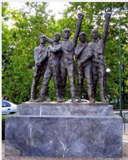
Γάτσας Στέργιος, 24 ετών Μπριάζης Ιωάννης, 29 ετών Στεργιόπουλος Κωνσταντίνος, 27 ετών Σύρμπας Κώστας, 22 ετών Τσανάκας Απόστολος, 22 ετών

76 χρόνια πέρασαν από την ημέρα που οι ναζί κατακτητές και οι ντόπιοι συνεργάτες τους, κρέμασαν στην πλατεία των Τρικάλων τους πέντε ΕΠΟΝίτες.