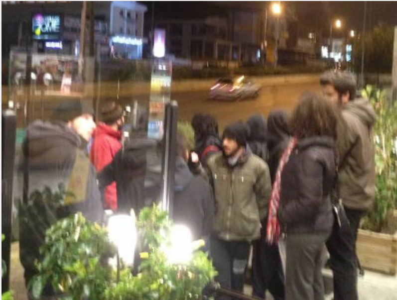
• Γέρακας - Σταυρός