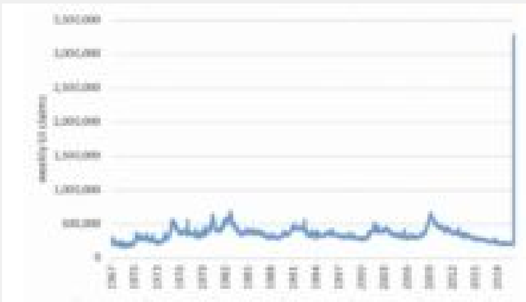
Διάγραμμα 3 - Εβδομαδιαίες αιτήσεις για επίδομα ανεργίας

Για να αναφέρουμε μόνο ένα παράδειγμα, κατά την πρώτη εβδομάδα της κρίσης του COVID-19, οι νέες εβδομαδιαίες αιτήσεις ανεργίας στο Οχάιο εκτοξεύθηκαν από 7.051 την εβδομάδα σε 78.000 . Οι νέες αιτήσεις αυτή την εβδομάδα ξεπέρασαν τα 3 εκατομμύρια σε εθνικό επίπεδο - σχεδόν πενταπλάσια του ιστορικού υψηλού της προηγούμενης εβδομάδας που είχε να ξανασυμβεί από το 1982. Οι απώλειες θέσεων εργασίας το καλοκαίρι, που υπολογίζονται στα 14 εκατομμύρια , θα ωθήσουν το ποσοστό ανεργίας πολύ πιο ψηλά από αυτό που καταγράφηκε στις χειρότερες μέρες της Μεγάλης Ύφεσης . Και τα πράγματα γίνονται ακόμα χειρότερα, όπως σημειώνει ο Josh Bivens του Ινστιτούτου Οικονομικής Πολιτικής, καθώς η ύφεση αυτή έχει «εστιάσει σε θέσεις εργασίας χαμηλόμισθες, χαμηλής παραγωγικότητας και part time ωραρίων στον τομέα των υπηρεσιών» .