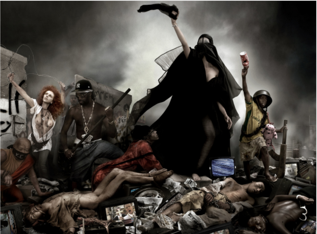
La liberté dévoilée, Gérard Rancinan