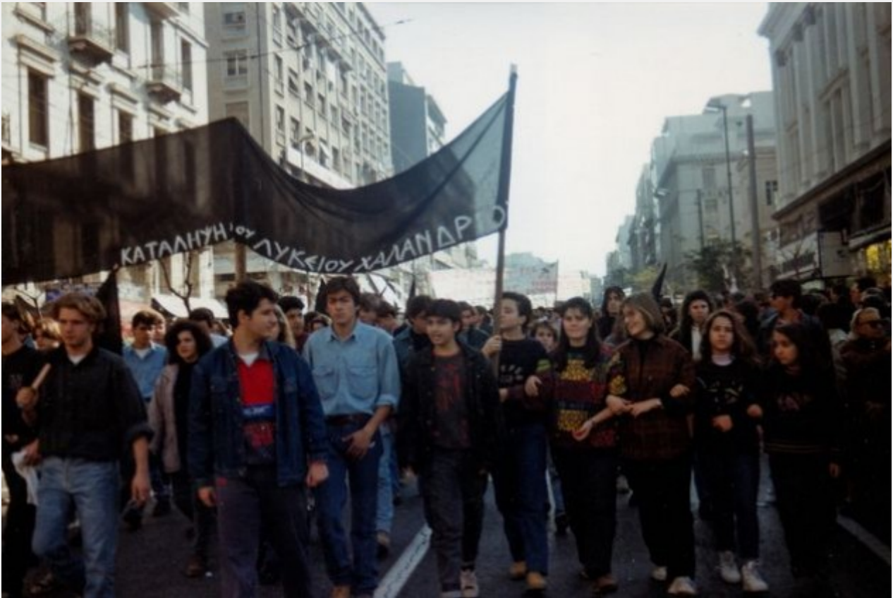
Διαδήλωση μετά την δολοφονία Τεμπονέρα- Αθήνα 10/1/1991 | Τάσος Κωστόπουλος

Ενα δεύτερο πεδίο αναμέτρησης υπήρξε η εξεταστική επιτροπή που συστήθηκε για το ζήτημα με ομόφωνη απόφαση της Βουλής (4/3/1991).