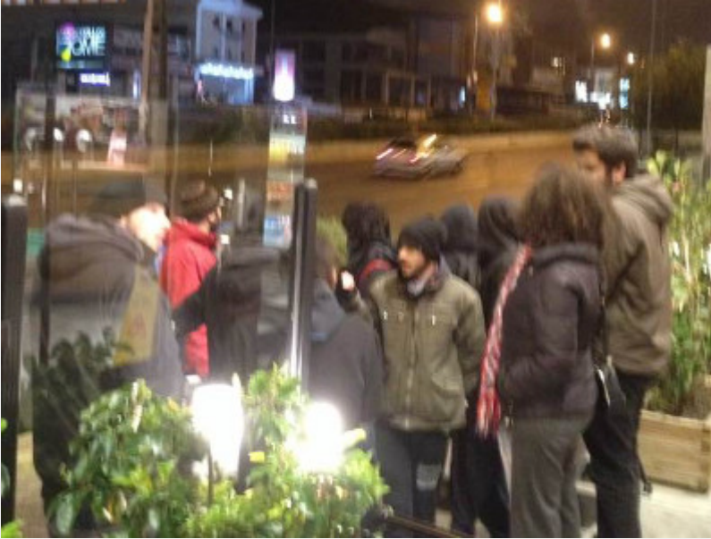
• Γέρακας - Σταυρός