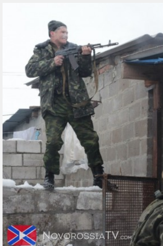
Μέλος των λαϊκών πολιτοφυλακών του Ντονμπάς την ώρα της μάχης

Η ουκρανική συγκυβέρνηση των νεοφιλελεύθερων και των ναζί φανερώνει καθημερινά το τερατώδες πρόσωπό της. Στέλνει τα χαμηλά στρώματα, τους καταδικασμένους στη φτώχεια Ουκρανούς να γίνουν κρέας για τα κανόνια για τα συμφέροντα των ολιγαρχών, του NATO και της ΕΕ. Πρόσφατα ο Όλεγκ Τουρτσίνοφ, αρχηγός κόμματος που συμμετέχει στην κυβέρνηση της Ουκρανίας πρότεινε όσοι άνεργοι αιτούνται κοινωνικά επιδόματα να στέλνονται και πρώτοι στην πρώτη γραμμή του μετώπου! (στα ουκρανικά: ΕΔΩ ) «Αν θες επίδομα ανεργίας, γίνε κρέας για τα κανόνια μας» είναι η σύγχρονη πολιτική πρόταση των αγαπημένων παιδιών της Δύσης.