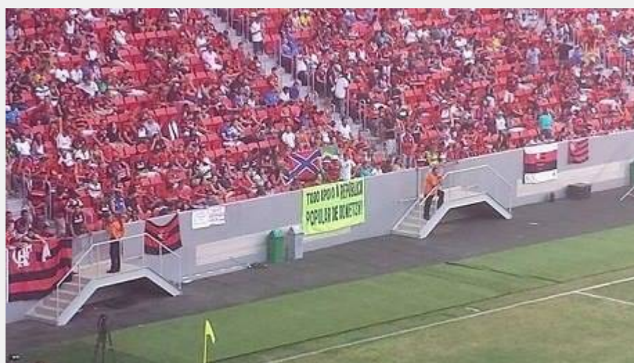
Κόκκινη Αλληλεγγύη στο Ντονμπάς μέχρι και στη Βραζιλία, κατά τη διάρκεια του φιλικού αγώνα της τοπικής Φλαμένγκο με την Σαχτάρ Ντονιέτσκ. "Πλήρη αλληλεγγύη στο Ντονιέτσκ" γράφει το πανό των οπαδών της Φλαμένγκο.