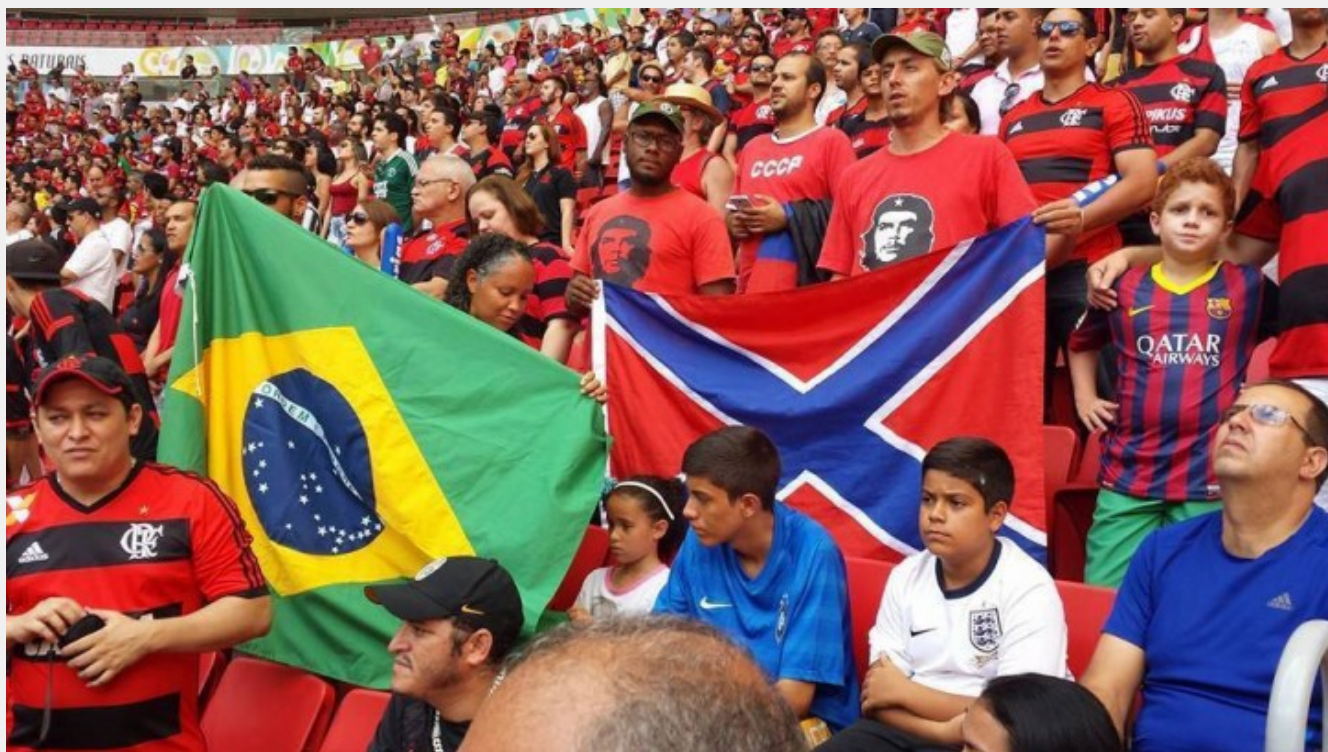
Κόκκινη Αλληλεγγύη στο Ντονμπάς μέχρι και στη Βραζιλία, κατά τη διάρκεια του φιλικού αγώνα της τοπικής Φλαμένγκο με την Σαχτάρ Ντονιέτσκ