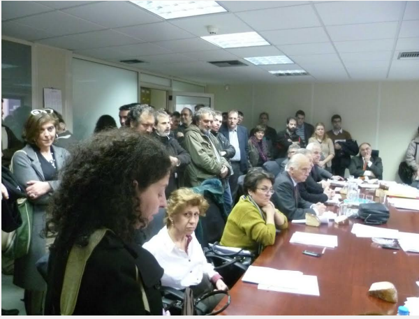
Κινητοποίηση μηχανικών στο ΕΤΑΑ, 13.2.2014

Στις 13.2.2014 πραγματοποιήθηκε ολοήμερη κινητοποίηση στο ΕΤΑΑ (το κοινό ταμείο μηχανικών, γιατρών, δικηγόρων) από την Ανοιχτή Συνέλευση Μηχανικών και το Σωματείο Μισθωτών Τεχνικών .