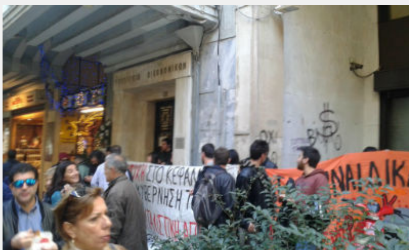
• Διαμαρτυρία στο ΥΠΟΙΚ ενάντια στο ξεπούλημα της δημόσιας περιουσίας 29/12/2015