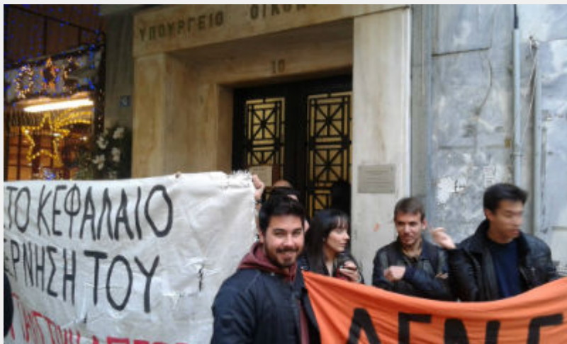
• Διαμαρτυρία στο ΥΠΟΙΚ ενάντια στο ξεπούλημα της δημόσιας περιουσίας 29/12/2015