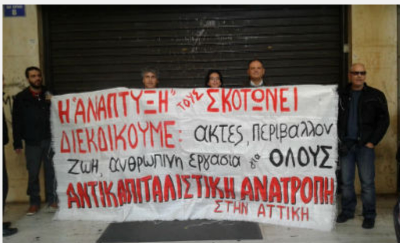
• Διαμαρτυρία στο ΥΠΟΙΚ ενάντια στο ξεπούλημα της δημόσιας περιουσίας 29/12/2015