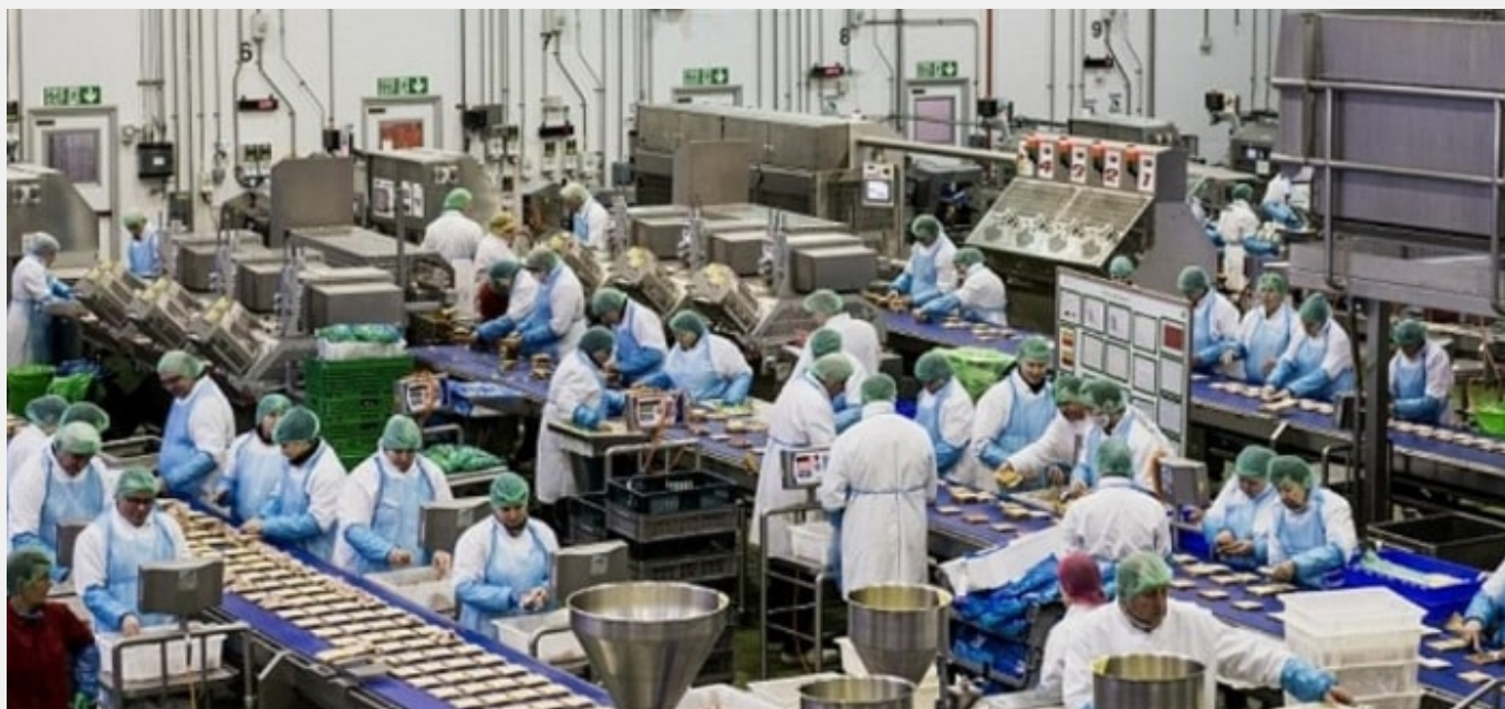
Μερικές/μερικοί από τους/τις 2000 εργάτριες/εργάτες στο εργοστάσιο της Greencore στο Nottinghamshire (2015). {Εψαχνα να θρω μια φωτογραφία από σύγχρονο, μαζικό εργασιακό χώρο, και δυσκολεύτηκα. Βρίσκει εύκολα φωτογραφίες με μοντέλα που φοράνε κάσκα ή χαμογελαστές νεαρές γυναίκες με μικρόφωνο, ρομαντικές ασπρόμαυρες φωτογραφίες από τα «παιδιά», όχι όμως πραγματικούς, σύγχρονους χώρους εργασίας, ειδικά στην Ελλάδα. Κι όμως, γνωρίζω κόσμο που εργάζεται στα τηλεφωνάδικα και στις κομπόστες. Αλλά κανείς δεν θέλει να τους δει. Ακόμη και τώρα. Καταναλώνουμε για να ζούμε. Αυτό κάποιι και κάπως φτιάχνεται. Και δεν φτιάχνεται όλο στο εξωτερικό. Συνεχίζουν να δουλεύουν έξω αυτοί οι άνθρωποι. Δεν μένουν σπίτι. Ακόμη και τώρα. Αόρατοι όμως. Καλά-καλά δεν τους βλέπει η google.}