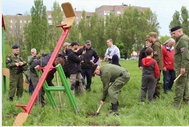
Φτιάχνοντας μια παιδική χαρά