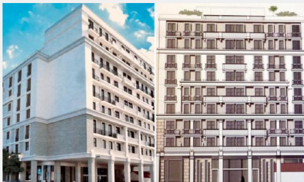
Πρόταση μετατροπής του κτιρίου του πρώην Υπουργείου Παιδείας στη Μητροπόλεως σε “νεοκλασικό”(!)

Πρόσφατα ήρθαν στη δημοσιότητα τα σχέδια της Εκκλησίας της Ελλάδος για το μέλλον του κτιρίου του πρώην Υπ. Παιδείας στην οδό Μητροπόλεως (που είναι ιδιοκτησία της). Μετά από δέκα διαγωνισμούς αξιοποίησης, το κτίριο περνάει στη διαχείριση του ξενοδοχειακού ομίλου του Γεράσιμου Φωκά και μετατρέπεται σε ξενοδοχείο. Οι διάφοροι «σωτήρες» του κέντρου της Αθήνας υποδέχτηκαν με ενθουσιασμό την είδηση. Στον ημερήσιο τύπο είδαμε άρθρα με τίτλους όπως «Η Εκκλησία δίνει ζωή σε κτίριο-φάντασμα του Κέντρου» που έρχονταν να σφραγίσουν το πνεύμα της «μεγάλης επένδυσης».