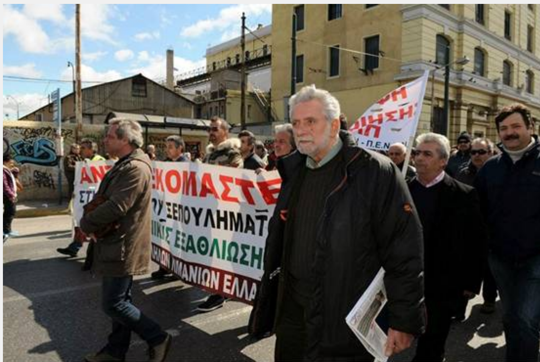
ΠΕΙΡΑΙΑΣ 11/03/14 ΠΟΡΕΙΑ ΕΝΑΝΤΙΑ ΣΤΗΝ ΨΩΤΙΚΟΠΟΙΗΣΗ ΤΟΥ ΟΛΠ