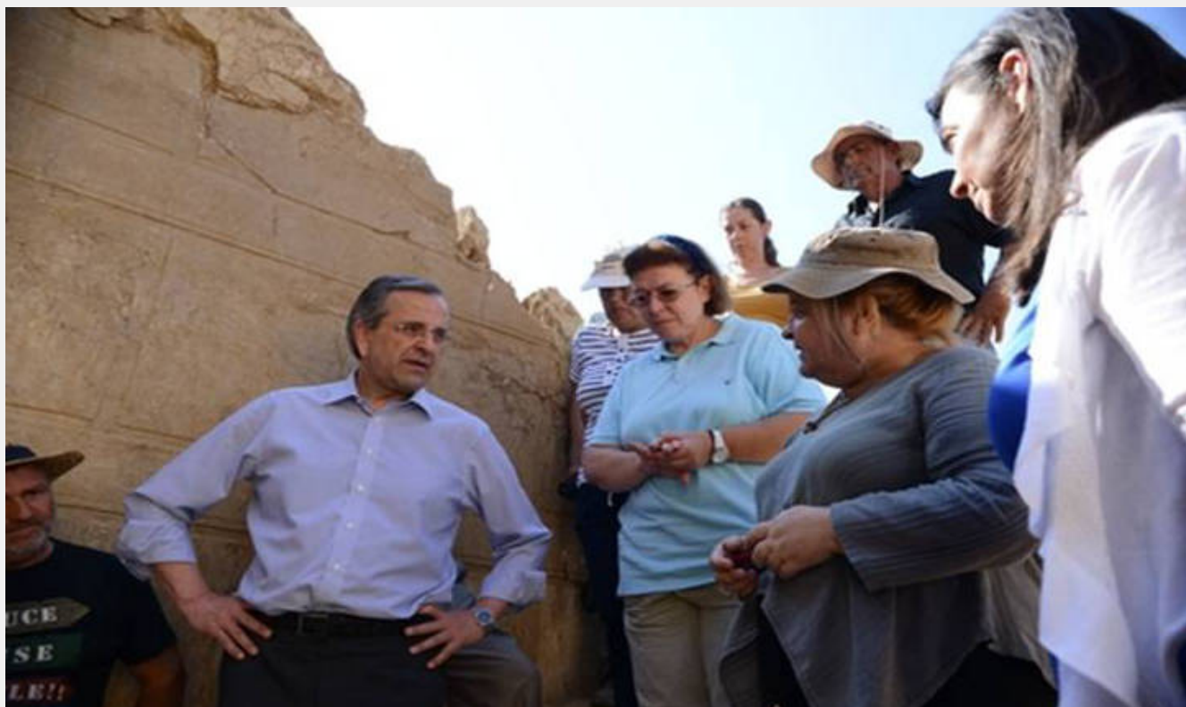
Αμφίπολη 12/8/2014. Βρείτε τον διευθυντή της ανασκαφής