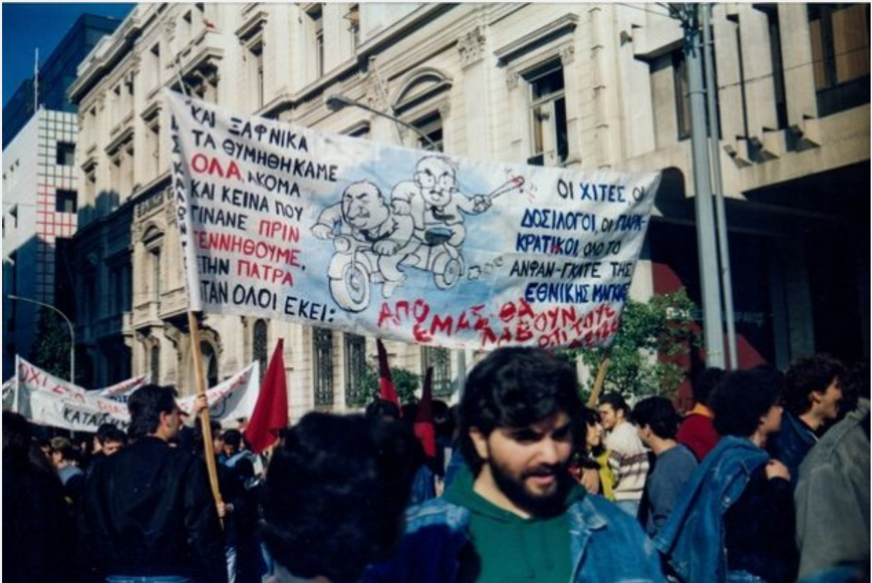
Το πανό των φοιτητών της Ανώτατης Σχολής Καλών Τεχνών στο πανεκπαιδευτικό συλλαλητήριο της 10ης Ιανουαρίου 1991. Μητσotάκης και Κοντογιαννόπουλος ως μετενσάρκωση των δολοφόνων του Γρηγόρη Λαμπράκη