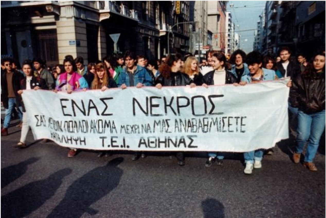
Χαρακτηριστικό πανό των διαδηλώσεων του πρώτου διημέρου μετά τη δολοφονία (Αθήνα, 9-10/1/1991)