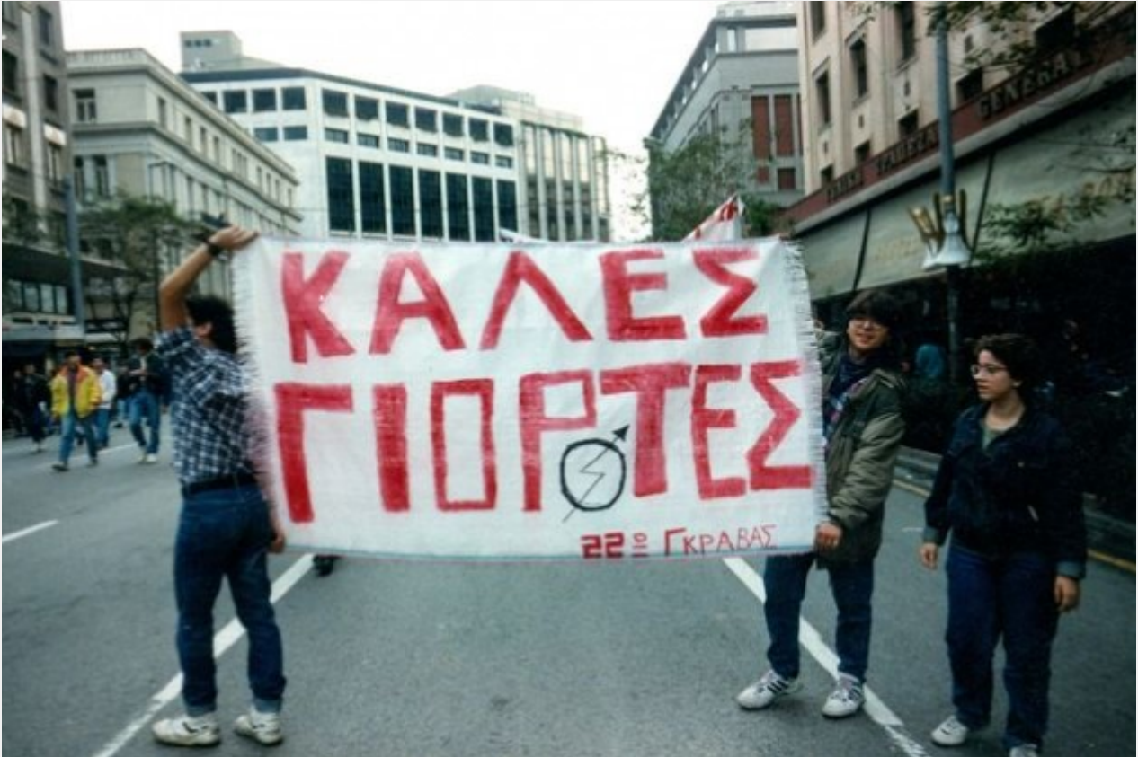
Αθήνα 18/12/1990. Η αντοχή των μαθητικών καταλήψεων εξόργισε την κυβέρνηση Μητσοτάκη Αθήνα 18/12/1990. Η αντοχή των μαθητικών καταλήψεων εξόργισε την κυβέρνηση Μητσοτάκη

Δεν απέμεινε παρά η προσφυγή στην παρακρατική βία. Ομάδες κρούσης «αγανακτισμένων πολιτών» της Ν.Δ. και της ΟΝΝΕΔ ανέλαβαν να σπάσουν διά ροπάλου τις καταλήψεις.