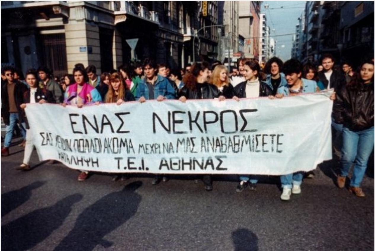
Χαρακτηριστικό πανό των διαδηλώσεων του πρώτου διημέρου μετά τη δολοφονία (Αθήνα, 9-10/1/1991)