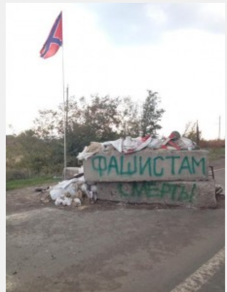
Θάνατος στο φασισμό

«Ότι η αντιπαράθεση, η ενδοαστική και ενδοϊμπεριαλιστική, ανάμεσα στις ΗΠΑ-ΕΕ και την καπιταλιστική Ρωσία, δεν πρόκειται να σταματήσει.» Ένας απ' τους τρεις που υπογράφουμε το παρόν κείμενο ήταν μάρτυρας των όσων περιγράφει ο «Ρ» και συγκεκριμένα της ρίψης όλμου σε κατοικημένο χωριό λίγα χιλιόμετρα μακριά απ' το αεροδρόμιο στο Ντονέτσκ. Όταν έσπευσε τμήμα λαϊκής πολιτοφυλακής στην περιοχή, ο αντάρτης γιος θρηνούσε για τη δολοφονημένη από την οβίδα των φασιστών μητέρα του. Η περιοριστική οπτική του «Ρ» οδηγεί στην υποτίμηση των πολεμικών επιχειρήσεων, των ναζιστικών θηριωδιών και της ιμπεριαλιστικής επιθετικότητας. Η ηρωική μάχη των λαϊκών πολιτοφυλακών για την ανακατάληψη του αεροδρομίου εκφράζει, άραγε, μια απόπειρα φιλορωσικών δυνάμεων για την ενίσχυση του πόλου της καπιταλιστικής Ρωσίας ή αντίθετα το δικαίωμα ενός εξεγερμένου ένοπλου λαού να υπερασπιστεί τον τόπο του από την εισβολή στρατού και φασιστών; Στις 16 Οκτωβρίου ο «Ρ» μας ενημερώνει ότι «σφοδρές μάχες γίνονται στην επαρχία του Λουγκάνσκ, όπου περίπου 100 Ουκρανοί στρατιώτες είναι περικυκλωμένοι από φιλορώσους πολιτοφύλακες». Έχει αποκλειστικές πληροφορίες για τα πολιτικά φρονήματα και τη φιλορωσική διάθεση των ανταρτών που ενεπλάκησαν σ' αυτή τη μάχη; Γιατί ακολουθώντας την αντίστοιχη πρακτική της «Αυγής», υιοθετεί κι ο «Ρ» τη φρασεολογία του Κιέβου και του δυτικού ιμπεριαλισμού για να χαρακτηρίσει το λαϊκό αντιφασιστικό αγώνα;