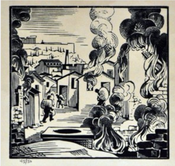
Το κάψιμο του συνοικισμού μετά το μπλόκο του Δουργούτιου, έργο του Κώστα Πλακωτάρη

Στην κατοχή μέναμε στην οδό Βοσπόρου 26. Το πρωί του Μπλόκου ακούσαμε τους πυροβολισμούς της μάχης . Κατόπιν τα χωνιά που καλούσαν τον κόσμο στην πλατεία Φάρου.