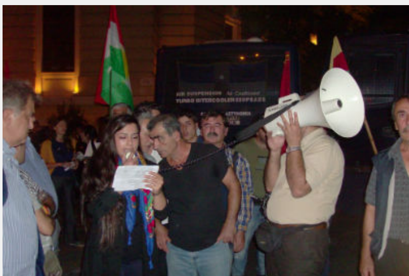
• Διαδήλωση αλληλεγγύης στον Κούρδικο και Τούρκικο λαό, Αθήνα, 12/12

Πολύ μαζική συγκέντρωση αλληλεγγύης στον κουρδικό και τουρκικό λαό και καταγγελίας της δολοφονικής επίθεσης στην Άγκυρα, πραγματοποιήθηκε σήμερα Δευτέρα στο Σύνταγμα, με πρωτοβουλία Κούρδων και Τούρκων πολιτικών προσφύγων και μεταναστών. Στα πανό των κούρδων και Τούρκων κυριαρχούν συνθήματα κατά του Τούρκου προέδρου Ρετζέπ Ταγίπ Ερντογάν, ενώ το κεντρικό πανό τους έγραφε “το κράτος δολοφόνος θα δώσει λογαριασμό”.