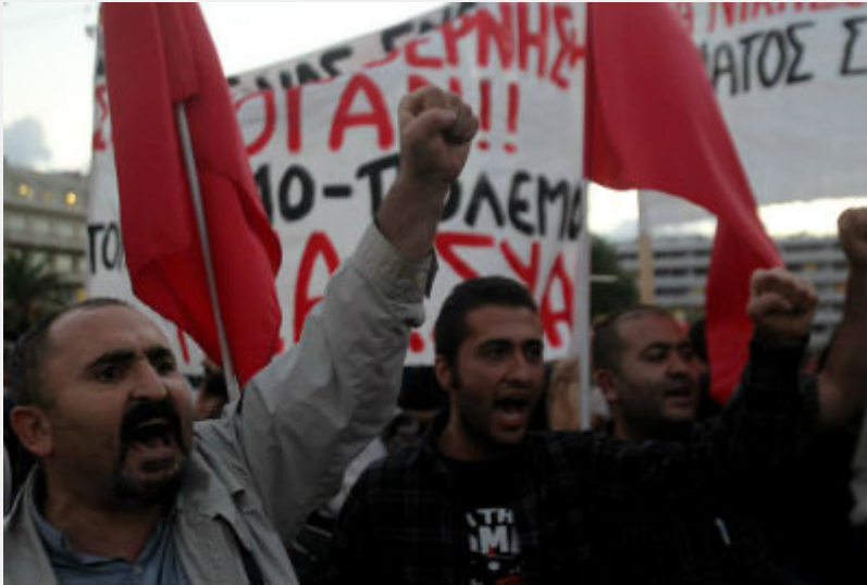
• Διαδήλωση αλληλεγγύης στον Κούρδικο και Τούρκικο λαό, Αθήνα, 12/12