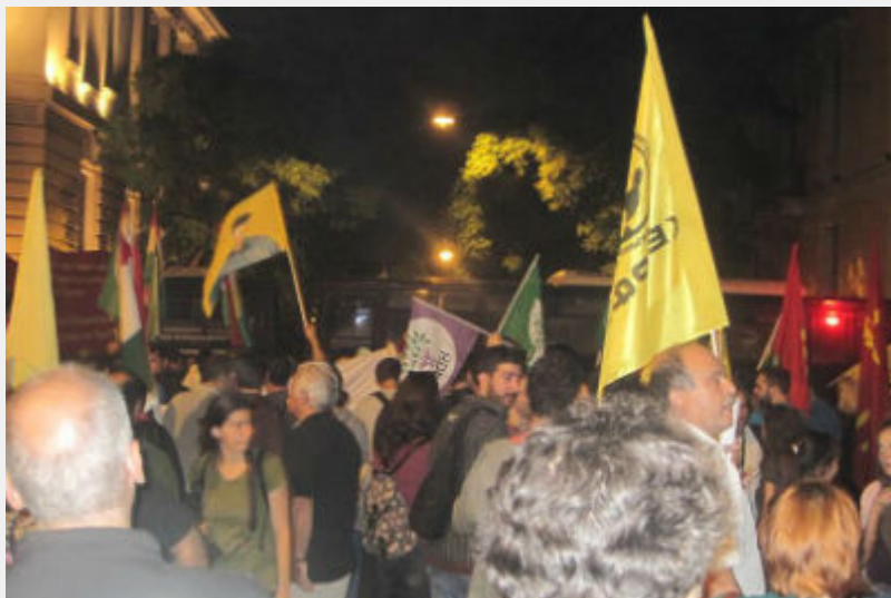
• Διαδήλωση αλληλεγγύης στον Κούρδικο και Τούρκικο λαό, Αθήνα, 12/12