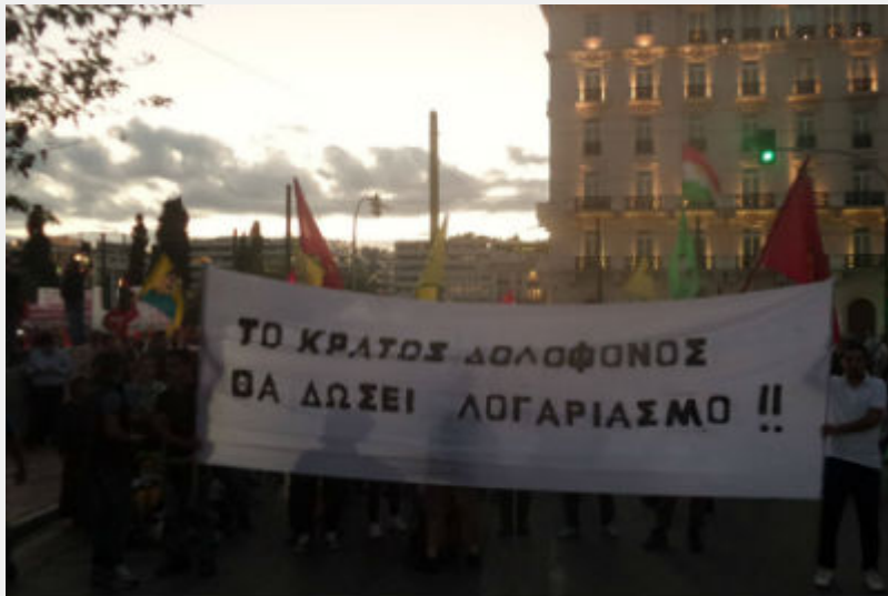
• Διαδήλωση αλληλεγγύης στον Κούρδικο και Τούρκικο λαό, Αθήνα, 12/12