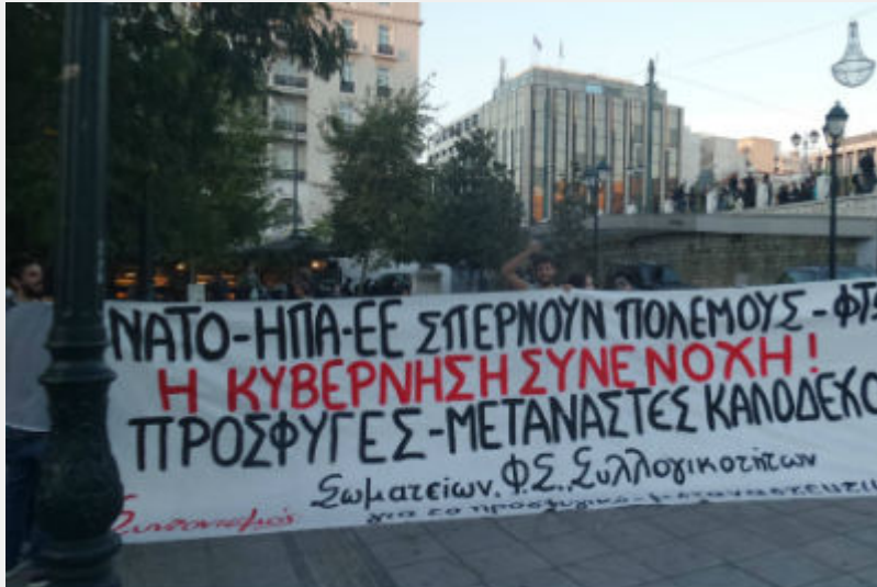
• Διαδήλωση αλληλεγγύης στον Κούρδικο και Τούρκικο λαό, Αθήνα, 12/12