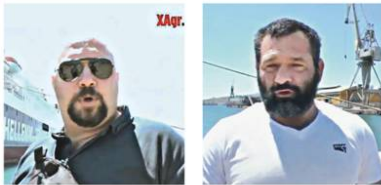
Μίκος, Παναγιώταρος και Λαγός προαναγγέλλουν την επίθεση στο Πέραμα

Αλλά υπάρχει και μια άλλη δύναμη της οργάνωσης που πιέζει με διαφορετικό τρόπο την κυβέρνηση. Είναι η υπόγεια διασύνδεσή της με επιχειρηματικά συμφέροντα και η δράση της ως συμπληρωματικού βραχίονα των μνημονιακών πολιτικών σε κρίσιμες περιοχές της χώρας. Πιο χαρακτηριστική είναι η περίπτωση του Περάματος. Είναι γνωστή η αιματηρή επίθεση 50 μελών της οργάνωσης εναντίον 20 αφισοκολλητών του ΠΑΜΕ, λίγες μέρες πριν από τη δολοφονία του Παύλου Φύσσα.