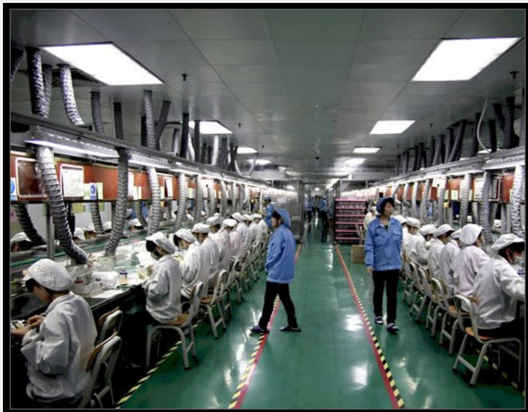
Μέσα στο εργοστάσιο της Foxconn

Η αμοιβή και οι συνθήκες εργασίας στη Foxconn είναι τόσο ανυπόφορες, ώστε το 5 τοις εκατό του εργατικού δυναμικού της - περίπου 24.000 άνθρωποι - παραιτούνται κάθε μήνα. Σύμφωνα με τους New York Times, ο μέσος εργαζόμενος της Foxconn κερδίζει $ 17 την ημέρα, δουλεύοντας 70 ώρες την εβδομάδα. Εν τω μεταξύ, ο Διευθύνων Σύμβουλος της Foxconn Terry Gou έχει ένα καθαρό κέρδος αξίας $ 5,9 δισ. Αυτό σημαίνει ότι ο μέσος εργαζόμενος της Foxconn θα πρέπει να εργαστεί 347 εκατομμύρια ημέρες, ή 951.000 χρόνια, για να αποκτήσει τόσα πολλά χρήματα, όπως κορυφαίο στέλεχός της. Και αν αυτό δεν είναι αρκετά κακό, οι εργαζόμενοι της Foxconn, πληρώνουν πρόστιμο, αν μιλήσουν στο χώρο εργασίας, ενώ οι φρουροί ασφαλείας περιπολούν τις γραμμές συναρμολόγησης για να ακούσουν τυχόν εργαζόμενους που παραβιάζουν την απαγόρευση ομιλίας.