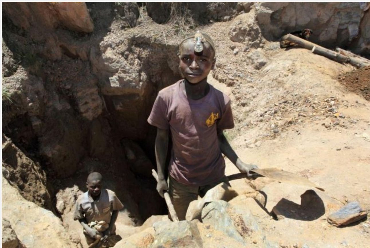
Ορυχείο κολτανίου στην Λαϊκή Δημοκρατία του Κονγκό.

Στον διαλυμένη από τον πόλεμο Λαϊκή Δημοκρατία του Κονγκό (ΛΔΚ), η παιδική εργασία έχει εντατικοποιηθεί κατά την τελευταία δεκαετία λόγω της αυξημένης ζήτησης για μέταλλα όπως το κοβάλτιο, ο χαλκός, το κολτάνιο. Επί του παρόντος, το 16,9 τοις εκατό των παιδιών, ηλικίας μεταξύ 5 και 14 ετών, εργάζονται στο Κονγκό στην εξορυκτική βιομηχανία. Και παρόλο που οι νόμοι του Κονγκό που αφορούν την εξόρυξη, απαγορεύουν στις ένοπλες δυνάμεις της χώρας να εκμεταλεύονται και να λειτουργούν τα μεταλλεία, ο ΟΗΕ εκτιμά ότι ο στρατός του Κονγκό ελέγχει περίπου το 50 τοις εκατό των 200 ορυχείων της Λαϊκής Δημοκρατίας του Κονγκό. Η Διεθνής Οργάνωση Εργασίας του ΟΗΕ χαρακτηρίζει την εξόρυξη, μία από τις χειρότερες μορφές παιδικής εργασίας, λόγω των πολλών κινδύνων για την υγεία, που συνδέονται με τη βιομηχανία.