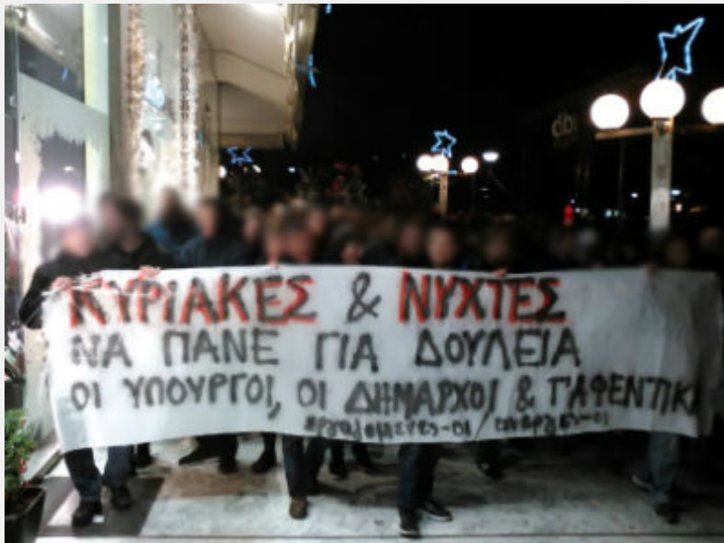
Κινητοποίηση ενάντια στην «κόκκινη νύχτα» στη Γλυφάδα το Σάββατο 19/12