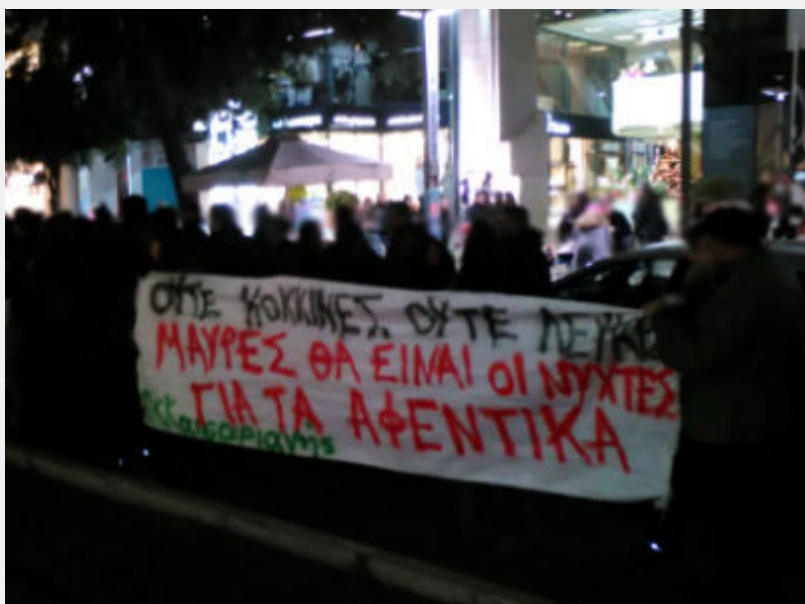
Κινητοποίηση ενάντια στην «κόκκινη νύχτα» στη Γλυφάδα το Σάββατο 19/12