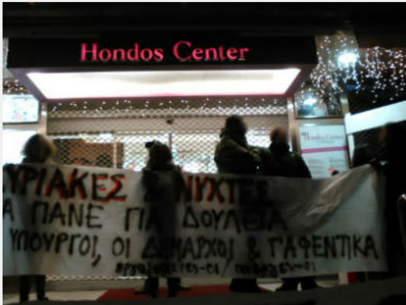
Κινητοποίηση ενάντια στην «κόκκινη νύχτα» στη Γλυφάδα το Σάββατο 19/12