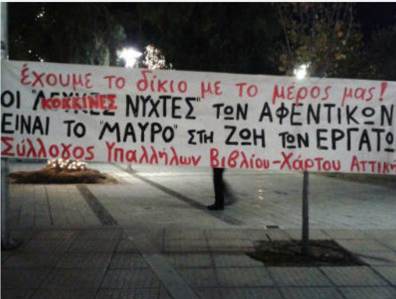
Κινητοποίηση ενάντια στην «κόκκινη νύχτα» στη Γλυφάδα το Σάββατο 19/12