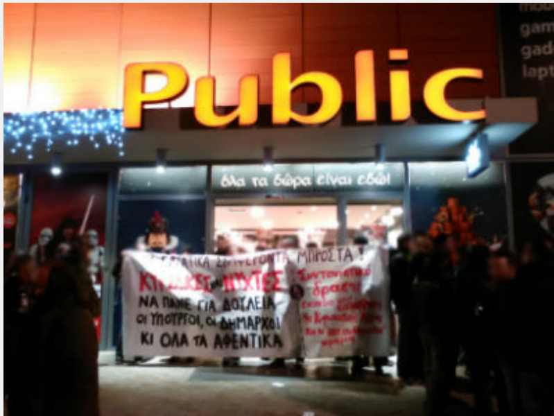
Κινητοποίηση ενάντια στην «κόκκινη νύχτα» στη Γλυφάδα το Σάββατο 19/12