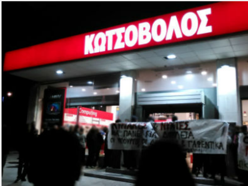
Κινητοποίηση ενάντια στην «κόκκινη νύχτα» στη Γλυφάδα το Σάββατο 19/12