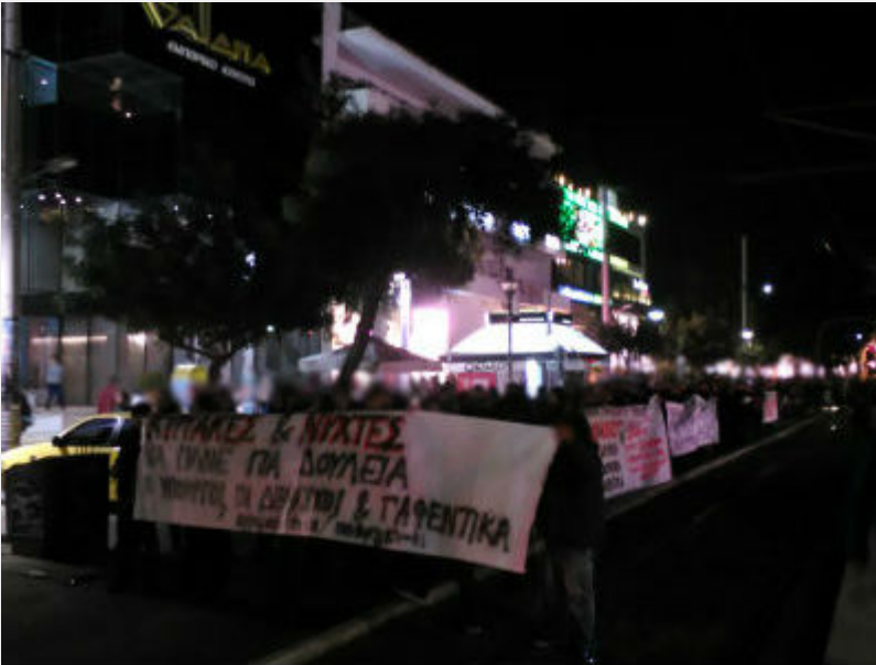
Κινητοποίηση ενάντια στην «κόκκινη νύχτα» στη Γλυφάδα το Σάββατο 19/12