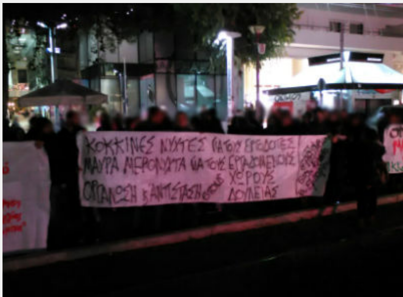
Κινητοποίηση ενάντια στην «κόκκινη νύχτα» στη Γλυφάδα το Σάββατο 19/12