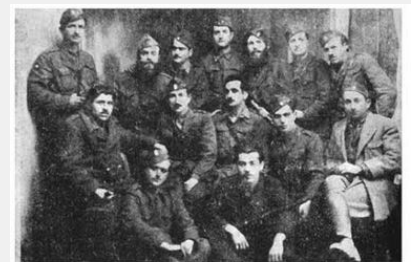
Αξιωματικοί και καπταίοι του 340 Συντάγματος του ΕΛΑΣ.