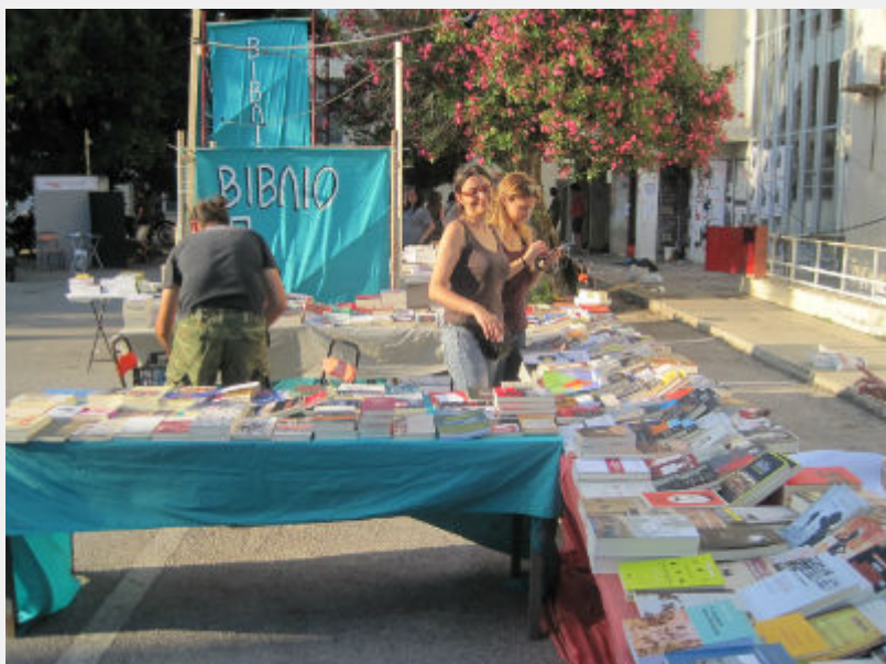
Φεστιβάλ Αναιρέσεις, 12_6