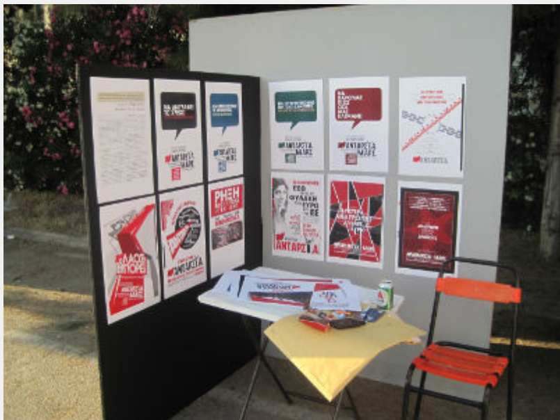
Φεστιβάλ Αναιρέσεις, 12_6