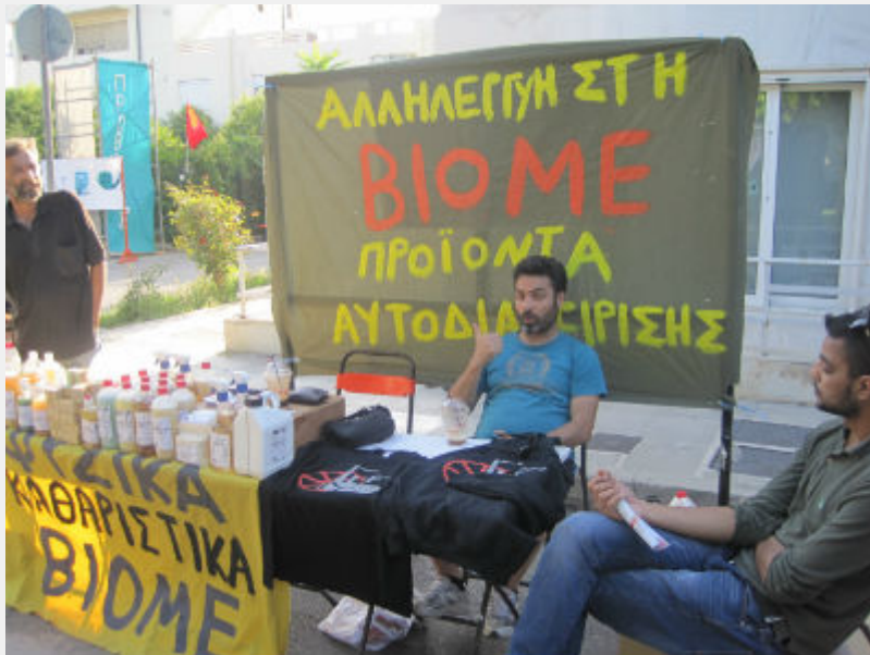
Φεστιβάλ Αναιρέσεις, 12_6