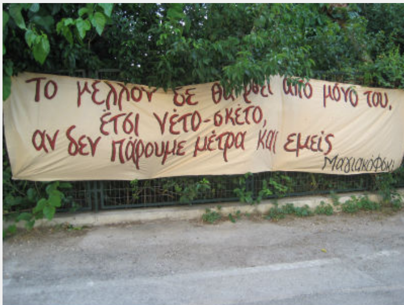
Φεστιβάλ Αναιρέσεις, 12_6