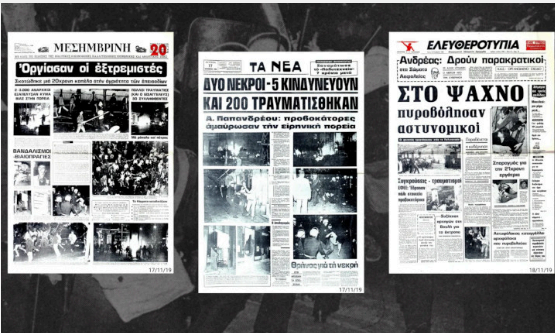
Το μακελειό της επετειακής πορείας του Πολυτεχνείου στα πρωτοσέλιδα του επόμενου διημέρου