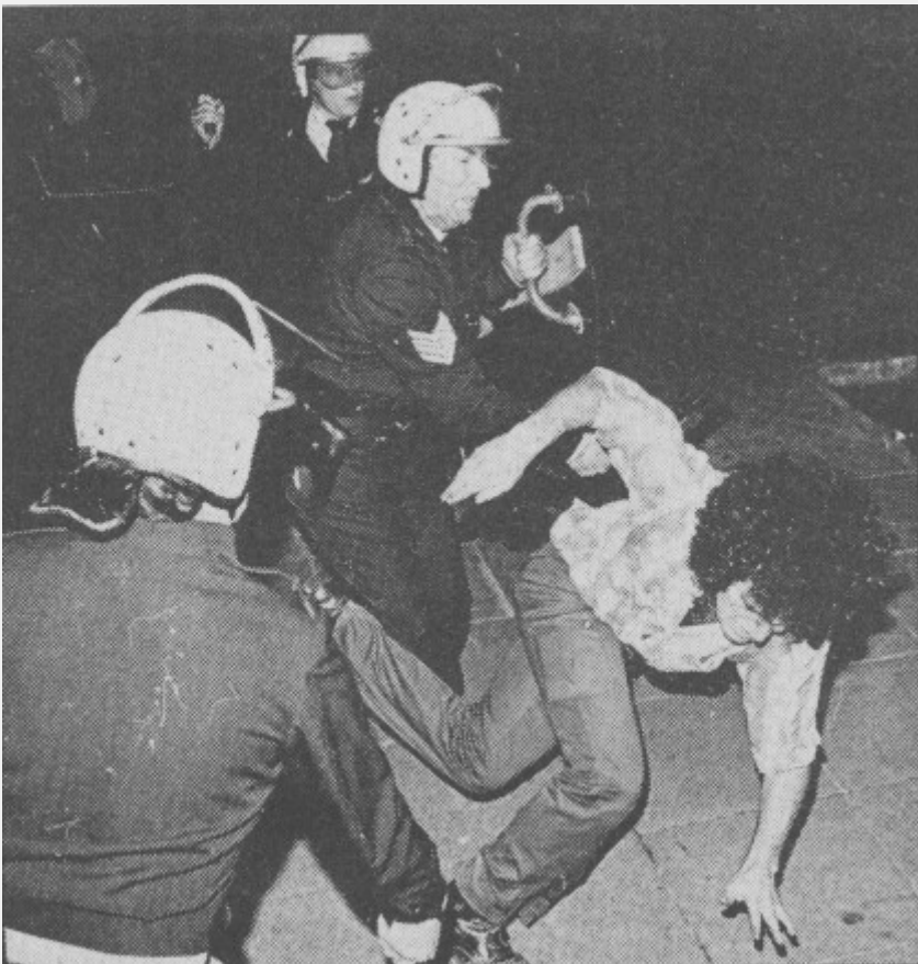
“Ο ΤΑΧΥΔΡΟΜΟΣ”, 27/11/1980

□ Σε πιο νηφάλιο κλίμα, ο πρόεδρος της ΕΔΑ, Ηλίας Ηλιού , έθεσε θέμα αντισυνταγματικότητας της απαγόρευσης της πορείας προς την αμερικανική πρεσβεία.