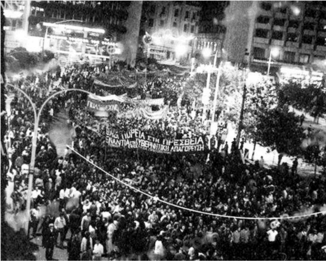
Το μπλοκ της μειοψηφίας της ΕΦΕΕ, με κεντρικό σύνθημα «Όλοι πορεία στην πρεσβεία», αναχαιτίστηκε από τα ΜΑΤ στα λουλουδάδικα της Βασ. Σοφίας.