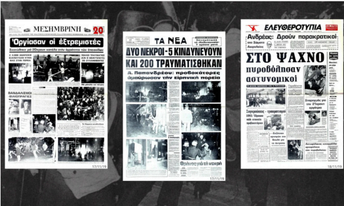
Το μακελειό της επετειακής πορείας του Πολυτεχνείου στα πρωτοσέλιδα του επόμενου διημέρου