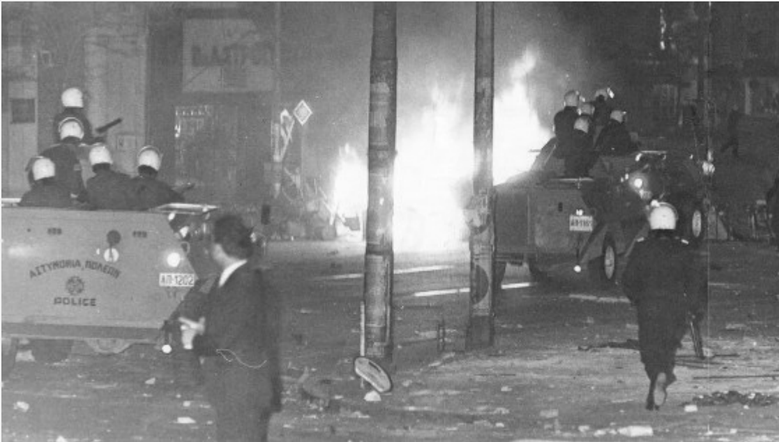
Το μπλοκ της

μειοψηφίας της ΕΦΕΕ, με κεντρικό σύνθημα «Όλοι πορεία στην πρεσβεία», αναχαιτίστηκε από τα ΜΑΤ στα λουλουδάδικα της Βασ. Σοφίας.