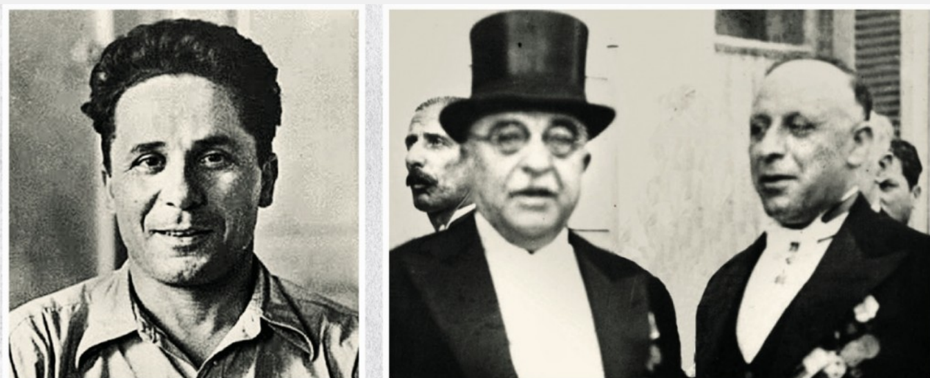
Οι Μεταξάς - Μανιάδης (δεξιά) φρόντισαν να δημοσιευτεί στον ψευδεπίγραφο «Ριζοσπάστη» που είχαν δημιουργήσει η πλαστή επιστολή του Νίκου Ζαχαριάδη

Υστερα από τα προαναφερόμενα τίθεται εκ των πραγμάτων ένα ερώτημα: Το εν λόγω πλαστό γράμμα είχε καμιά χρησιμότητα για το μεταξικό καθεστώς; Αναμφισβήτητα είχε, αλλά για απειροελάχιστο χρονικό διάστημα. Όπως αποδεικνύεται από αδιάσειστα ιστορικά στοιχεία, η Ασφάλεια φρόντισε ώστε ο «Ριζοσπάστης» της Προσωρινής Διοίκησης, της 1ης Οκτωβρίου 1940, με το πλαστό γράμμα του Ζαχαριάδη να φτάσει στους φυλακισμένους και εξόριστους κομμουνιστές. Οι εξόριστοι της Ανάφης, π.χ., το αναδημοσίευσαν στον Τύπο που εξέδιδαν. Μια τέτοια δημοσίευση βρίσκεται στο Δελτίο που εξέδιδε, ως όργανό της, η «Κομματική Φράξια Πολιτικών Εξοριστών Ανάφης».