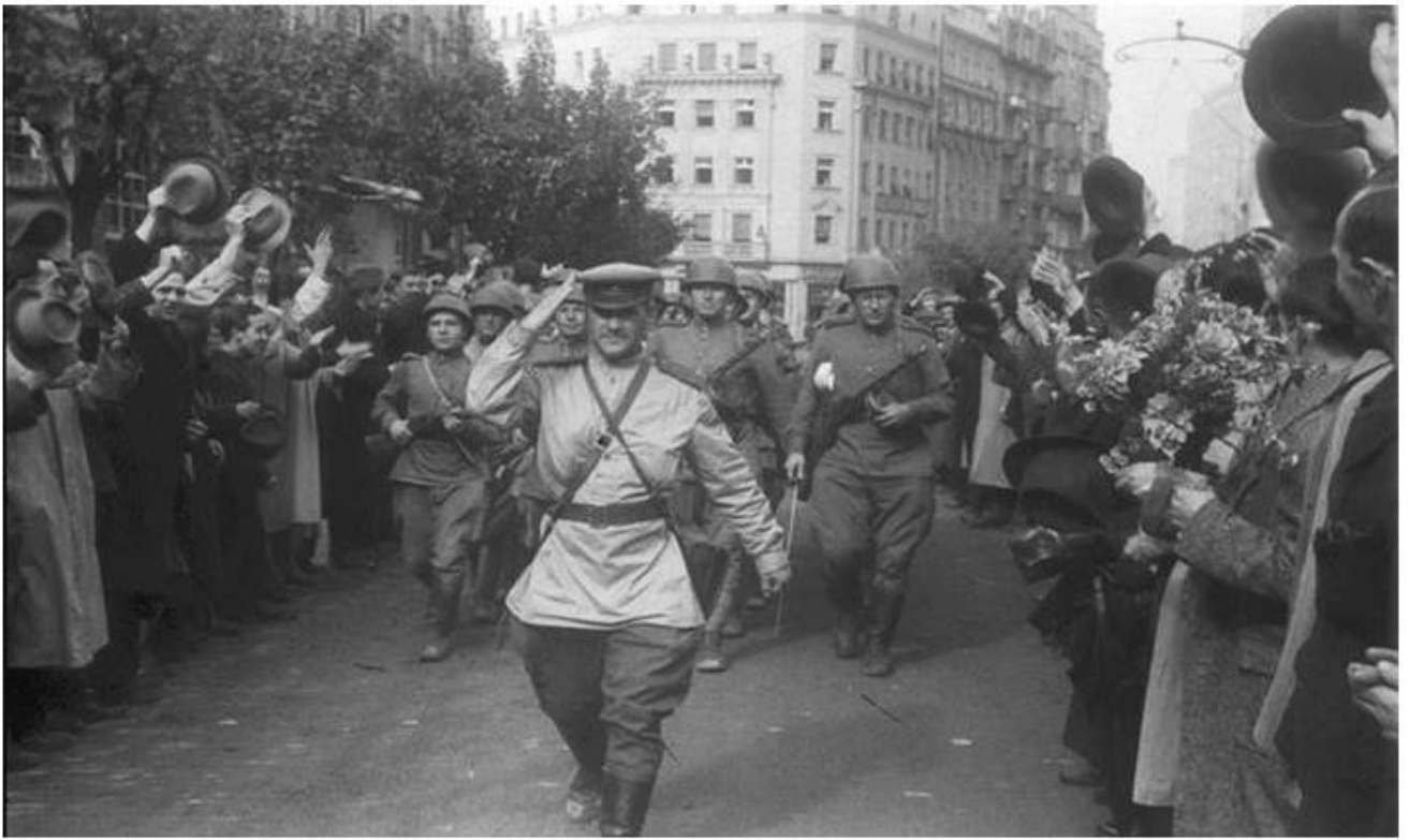
Η υποδοχή του κόκκινου στρατού από τους κατοίκους του Βελιγραδίου μετά την απελευθέρωση της πόλης από τους Γερμανούς

Τα έργα του Τσβέτκοβιτς βρίθουν λαθών κι ανακρίβειών (π.χ. παρουσιάζει τον Τίτο να εισέρχεται στην πόλη ως απελευθερωτής πάνω σε άσπρο άλογο στις 20/10/1944 ενώ στην πραγματικότητα εισήλθε επιβαίνοντας σε στρατιωτικό όχημα στις 25/10) όμως αυτό είναι μια δευτερεύουσα πλευρά. Το πρωταρχικό ζήτημα είναι η οργανωμένη επιχείρηση αναθεώρησης της ιστορίας του Γιουγκοσλαβικού χώρου, με μέλημα την «αποκαθήλωση» των όσων αντιστάθηκαν στις δυνάμεις του Άξονα και τους ντόπιους συνεργάτες τους και τη συνακόλουθη προσεκτική καθαγίαση των τελευταίων.