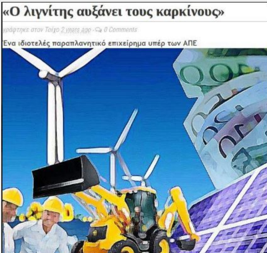
Εικόνα 1. Κρύβει ιδιοτέλεια το επιχείρημα για τους λιγνιτικούς καρκίνους;

Μόνιμη και σταθερή απάντηση των υπερασπιστών εγκατάστασης των βιομηχανικών, μεταβλητών ΑΠΕ (Αιολικά + Φωτοβολταϊκά) στη χώρα μας, προς τα κινήματα που αγωνίζονται ενάντια στις εγκαταστάσεις των, είναι ότι «πρέπει να μπουν για να σταματήσει η καύση του λιγνίτη που γεμίζει ρύπανση και καρκίνους, ειδικότερα στους κατοίκους του Λεκανοπεδίου Κοζάνης -Πτολεμαΐδας Φλώρινας».