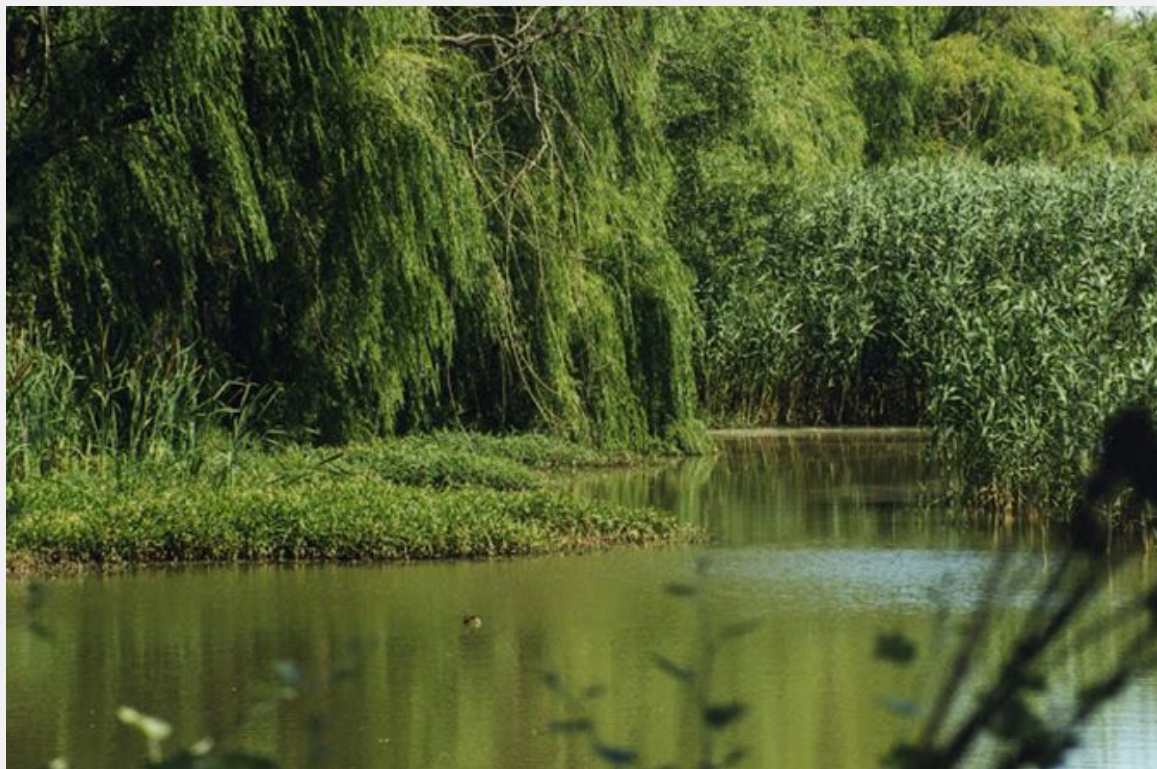
Εικόνα 7. Υδροβιότοπος σε αποκατεστημένα εδάφη πρώην λιγνιτωρυχείων