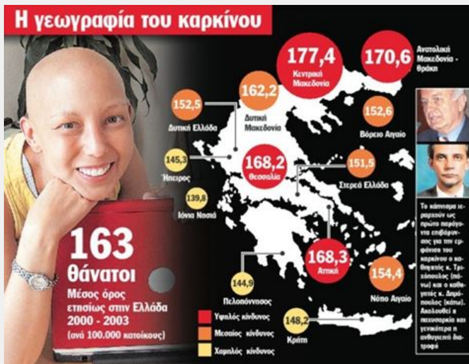
Εικόνα 3. Η «Καρκινολογία» της Ελλάδας

• Σε ό,τι αφορά τους καρκίνους δεν έχει διαπιστωθεί επιστημονικά ότι οι λιγνιτικές Περιοχές έχουν μεγαλύτερα ποσοστά από άλλες περιοχές.[5] Αντίθετα με βάση στατιστικές μελέτες, κάποιες περιοχές που δεν έχουν ιδιαίτερη βιομηχανική δραστηριότητα παρουσιάζουν μεγαλύτερα ποσοστά. «Η Δράμα μαζί με το Κιλκίς, την Καρδίτσα και τα Γρεβενά, καταλαμβάνουν τις τέσσερις πρώτες θέσεις σε θνησιμότητα από καρκίνο» [6]