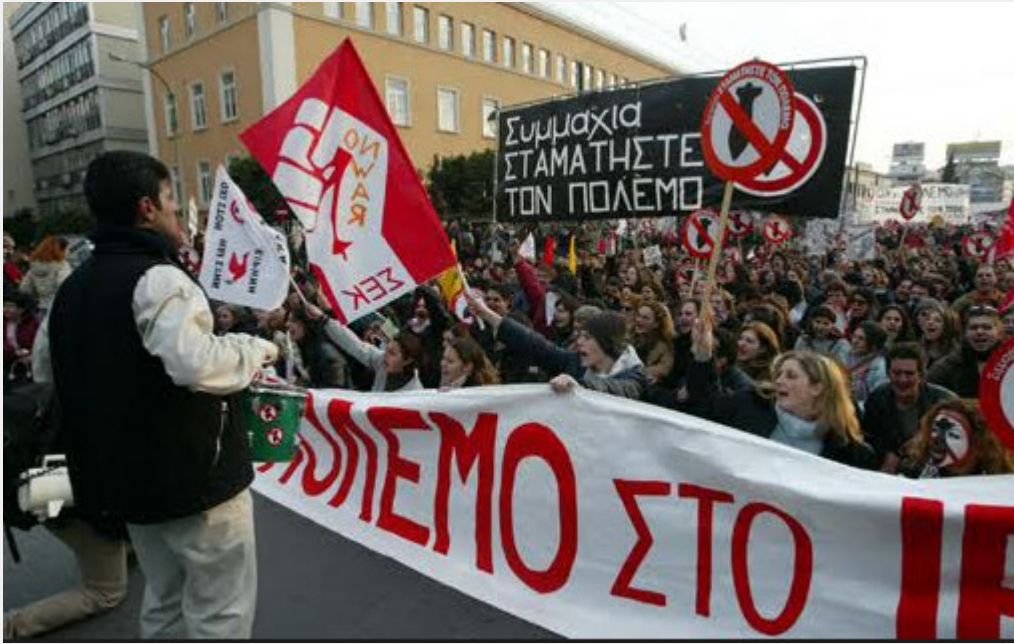
Στο μεγάλο αντιπολεμικό συλλαλητήριο 15 Φλεβάρη 2003

συλλόγους, κόμματα της Αριστεράς σε αυτή την πανστρατιά.