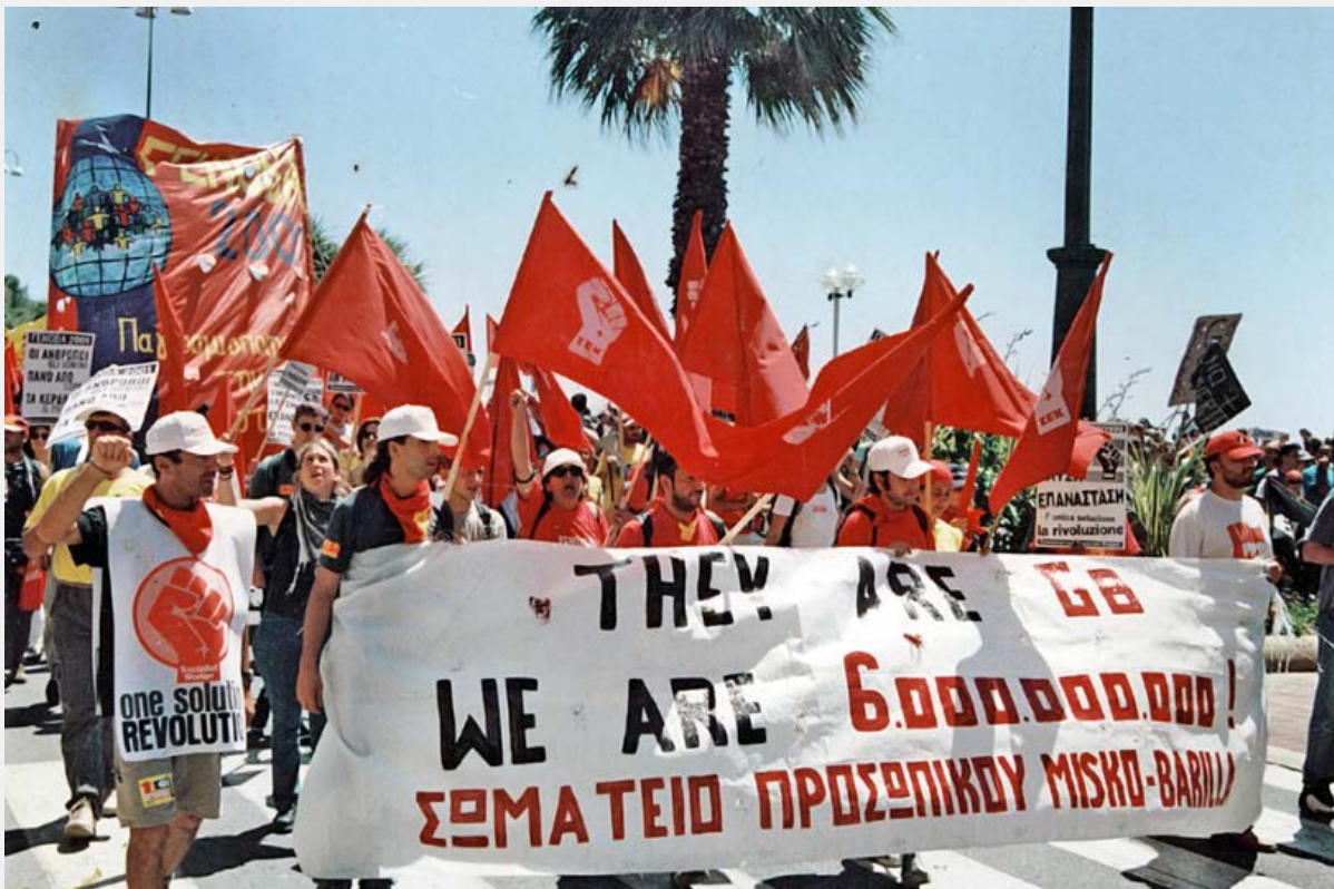
Γένοβα, Ιούλης 2001

Και βέβαια καθοριστικές ήταν οι εμπειρίες της αλυσίδας των πολιτικών επιλογών και μαχών που άνοιξε για την Αριστερά το κίνημα του Σιάτλ και της Γένοβα όπως έμεινε στην ιστορία που συναντήθηκε και αλληλοτροφοδοτήθηκε με το μεγάλο αντιπολεμικό κίνημα του 2003-4. Εμπειρίες που είχανε μια διπλή διάσταση.