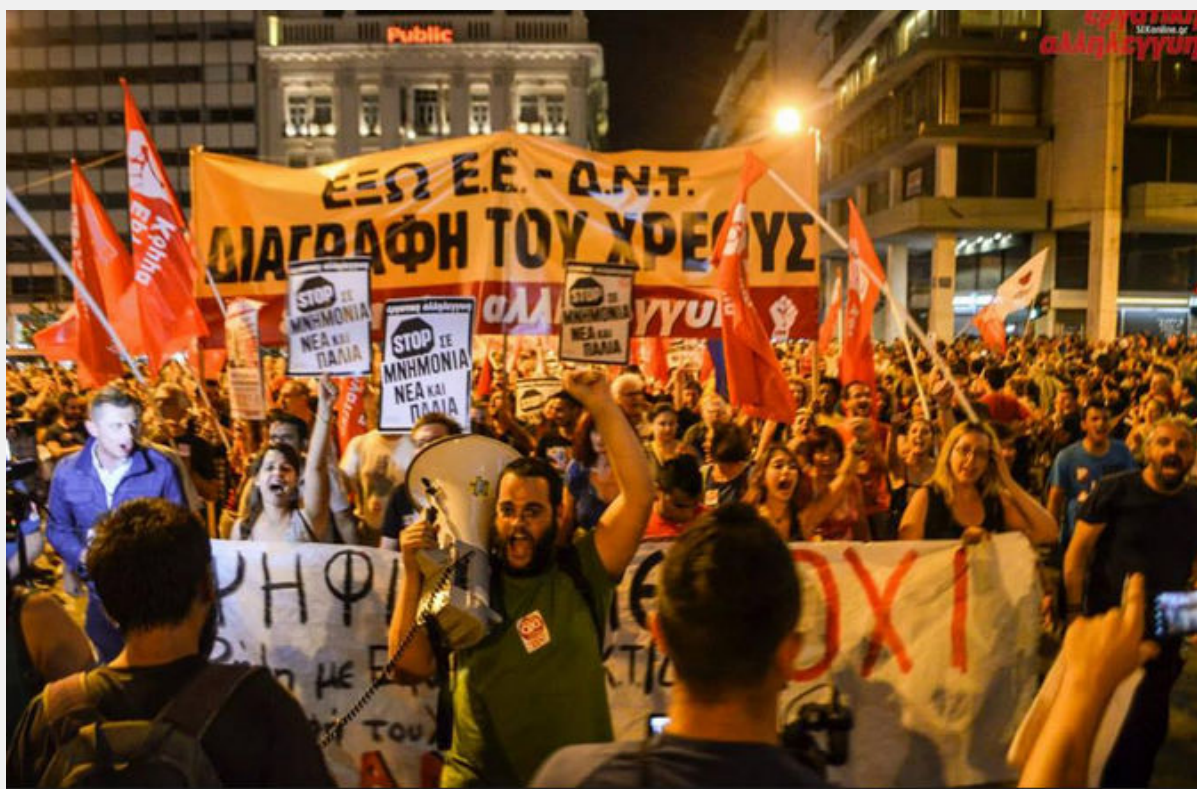
Η νύχτα της νίκης του ΟΧΙ στο δημοψήφισμα