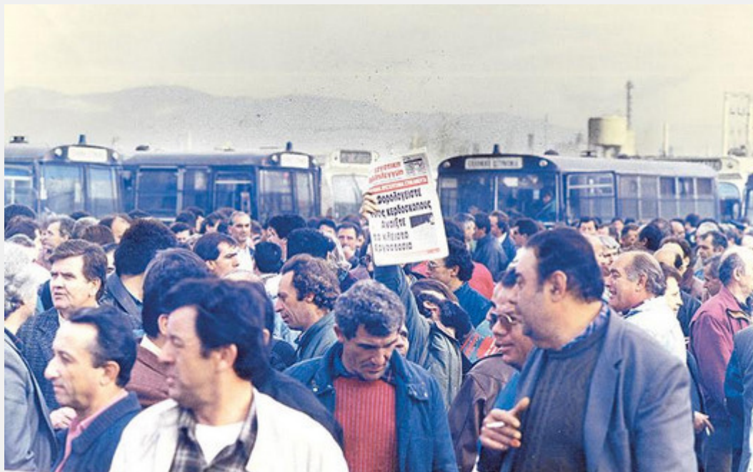
Δεκέμβρης 1993 οι απεργοί της ΕΑΣ επιστρέφουν νικητές στο αμαξοστάσιο της Π. Ράλλη