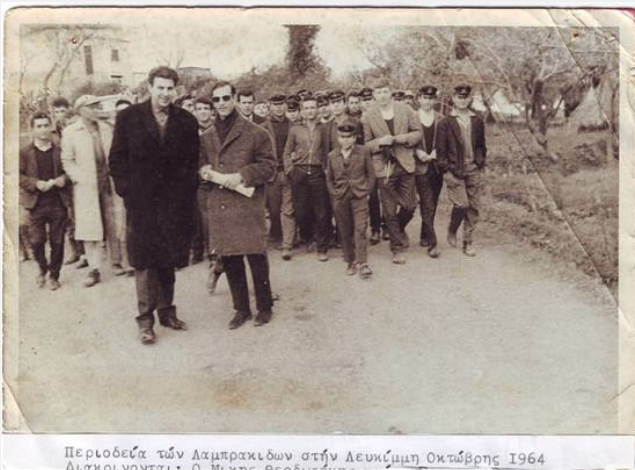
Περιοδεία των Λαμπρακιδων στην Λευκίμμη Οκτώβρης 1964 Διακρίνονται: Ο Μίκης Θεοδωράκης...

Τη Λευκίμμη, που ξέχασαν τόσο γρήγορα ότι αυτή τους εξέλεξε, ξέχασαν τα αποτελέσματα των τελευταίων δημοτικών εκλογών ; (ΚΚΕ 26%, ΣΥΡΙΖΑ 31% στο Α' και 60% στον Β' γύρο), ξέχασαν τα αποτελέσματα των ευρωεκλογών ; (ΣΥΡΙΖΑ 45%, ΚΚΕ 10%, ΑΝΤΑΡΣΥΑ 1,6%), ή μήπως ξέχασαν το δημοψήφισμα στο οποίο η Λευκίμμη δίνει ένα από τα συντριπτικότερα ποσοστά πανελλαδικά με 78,53% υπέρ του ΟΧΙ ?