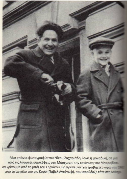
Μια σπάνια φωτογραφία του Νίκου Ζαχαριάδη, ίσως η μοναδική, σε μια από τις λιγοστές επισκέψεις στη Μόσχα απ' την εκτόπιση του Μποροβίκοβ. Αν κρίνουμε από το μπόι του Σηφάκου, θα πρέπει να 'χει τραβηχτεί γύρω στο 1937 από το μεγάλο του γιο Κύρο (Πάβελ Αντόνωφ), που σπούδαζε τότε στη Μόσχα.

Πρέπει να μιλάμε συχνά για τους στρατιώτες που τους χτύπησε πρόωρα η πίσωπλατη λησμονιά του κόσμου. Σίγουρα θα θυμούνται ακόμα εκεί κάτω πώς αποκόπηκαν ξαφνικά απ το γήινο γάλα. Κάποιες νύχτες ακούω το στεναγμό τους πίσω απ' τον κωφάλαλο τοίχο. Οι ψυχές τους κλαίνε σα βρέφη, ζητώντας επίμονα τη μητρική στοργή της Ανθρωπότητας, το χάδι της και την έγνοια. Θέλουνε να μιλάμε αδιάκοπα γι αυτούς... Γιατί η ανθρώπινη μνήμη έχει τη δύναμη να νικάει την άσπλαχνη λήθη των θεών.