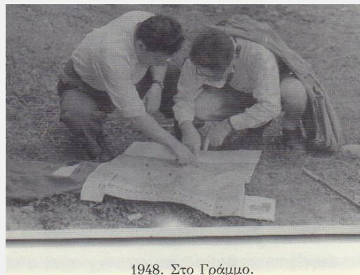
1948. Στο Γράμμο.

Εννοείται βέβαια ότι η κριτική είναι δασκάλα της εμπειρίας και της γνώσης, αρκεί να γίνεται δίχως εμπάθεια και ευτελείς προσωπικούς λόγους, αλλά με αίσθημα ιστορικής ευθύνης, με ανάλογο σεβασμό και περίσκεψη -έτσι όπως κάνουν οι άνθρωποι μέσα στην ίδια τους την οικογένεια-, για όσους πρωτοστάτησαν στη δημιουργία μιας μεγάλης ιστορικής εποχής, ανεβάζοντας το επίπεδο των λαϊκών αγώνων μέχρι την ένοπλη σύγκρουση με τους ξένους και ντόπιους δυνάστες κάθε μορφής. Αυτό, ακόμα κι από μόνο του, ήταν μια μεγάλη ηθική νίκη με τεράστια θετική επίδραση στις επόμενες γενιές - έστω κι αν δεν έφερε το αναμενόμενο στρατηγικό αποτέλεσμα.