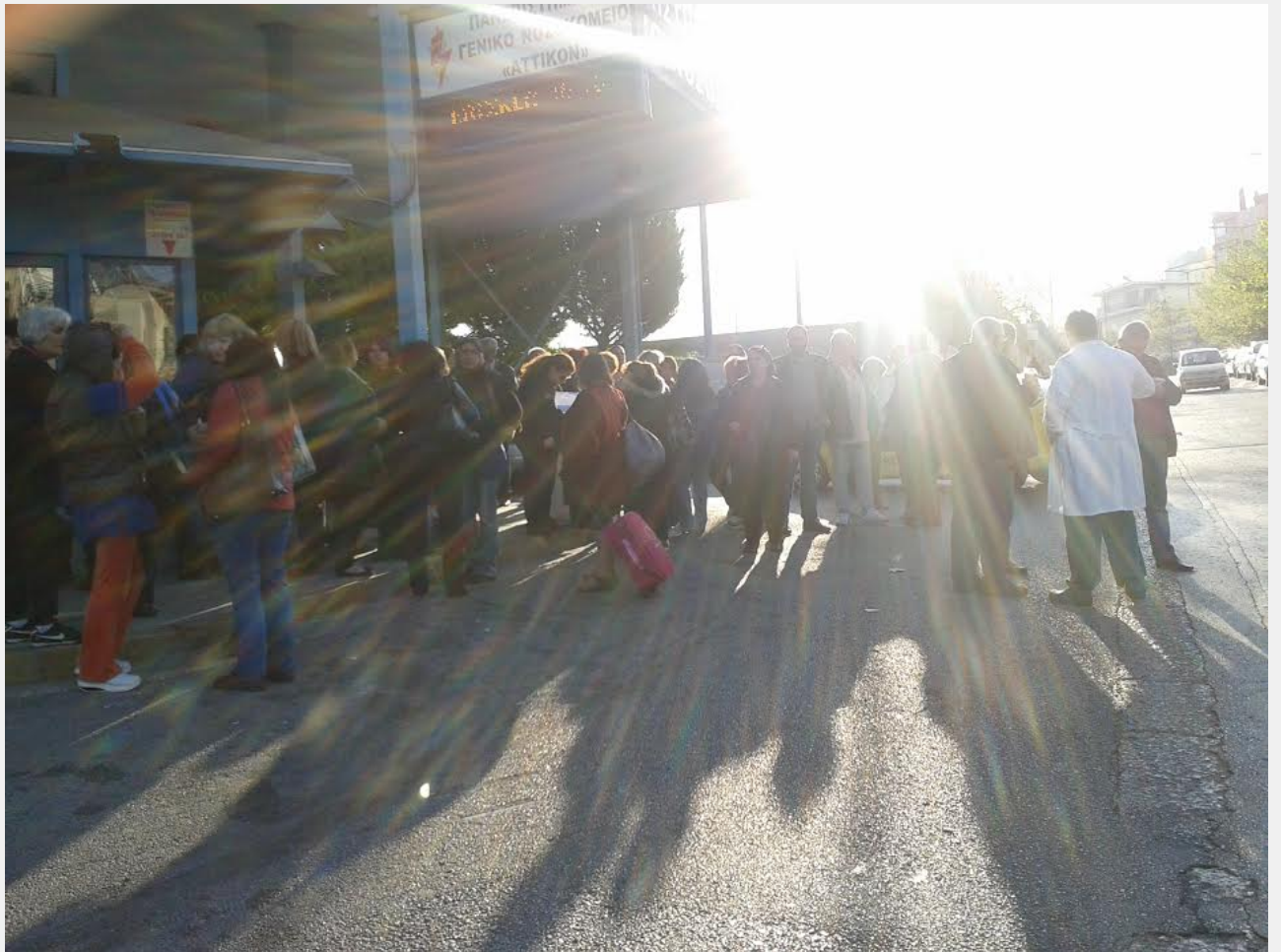
• κινητοποίηση καθαριστριών στο Αττικό 21_4_2015