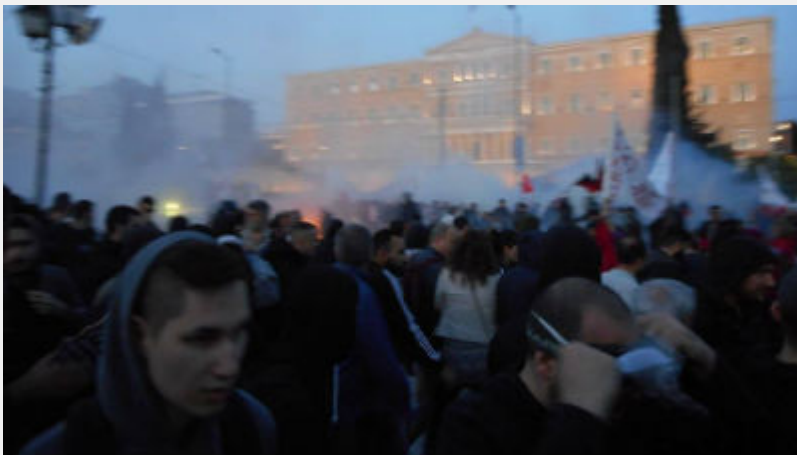
• Συλλαλητήριο 8 Μάη στο Σύνταγμα