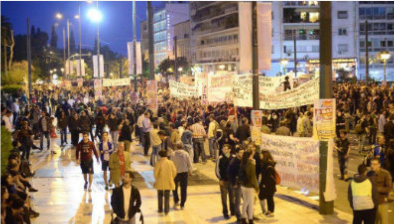
• Συλλαλητήριο 8 Μάη στο Σύνταγμα