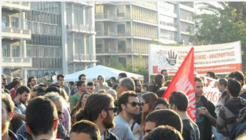
Συλλαλητήριο 8 Μάη στο Σύνταγμα