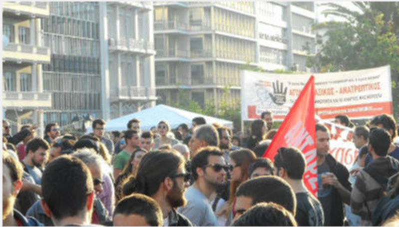
Συλλαλητήριο 8 Μάη στο Σύνταγμα