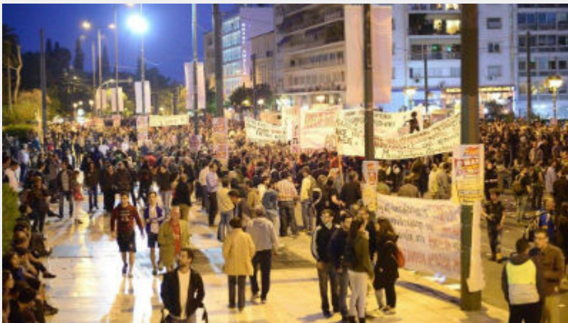
• Συλλαλητήριο 8 Μάη στο Σύνταγμα