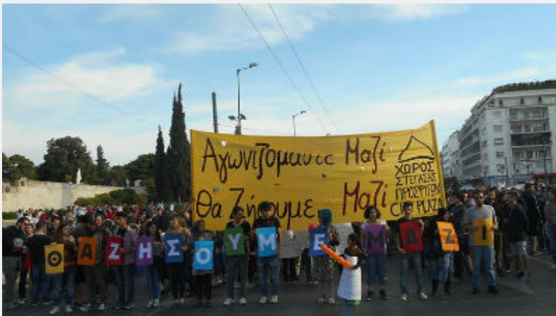
• Συλλαλητήριο 8 Μάη στο Σύνταγμα