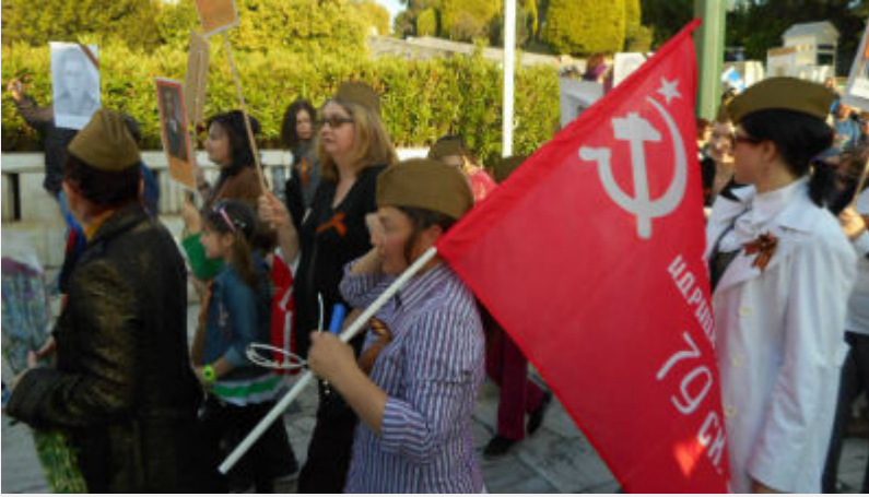
• Συλλαλητήριο 8 Μάη στο Σύνταγμα