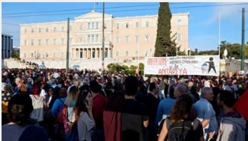
Συλλαλητήριο 8 Μάη στο Σύνταγμα