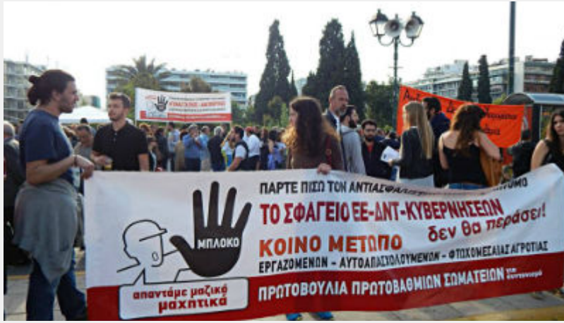
Συλλαλητήριο 8 Μάη στο Σύνταγμα