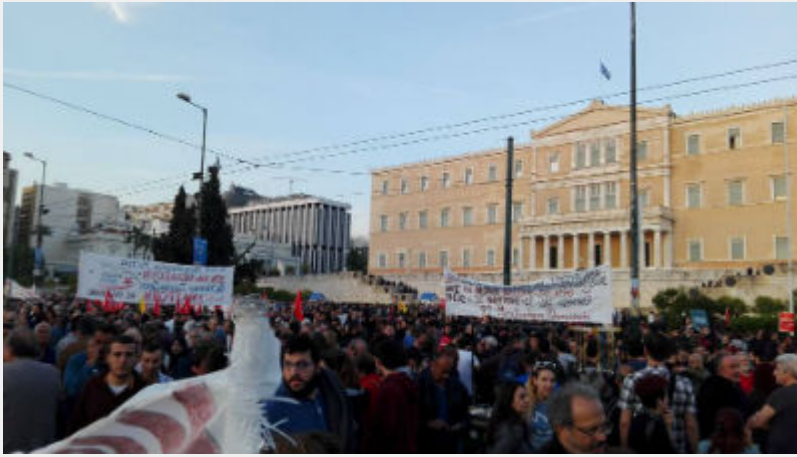
• Συλλαλητήριο 8 Μάη στο Σύνταγμα