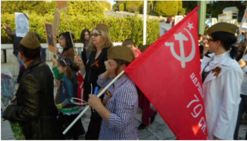
• Συλλαλητήριο 8 Μάη στο Σύνταγμα