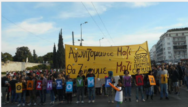
• Συλλαλητήριο 8 Μάη στο Σύνταγμα