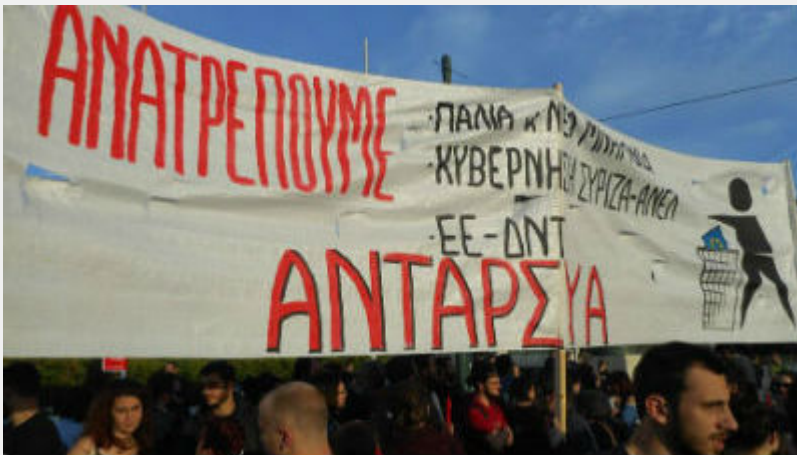
• Συλλαλητήριο 8 Μάη στο Σύνταγμα