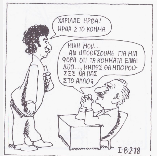
Σκίτσο του Γιάννη Ιωάννου στο ANTI

-Στις πρώτες μεταδικτατορικές εκλογές, το 1974 , η τηλεόραση τον παρουσιάζει να εκφωνεί λόγο ως υποψήφιος της Ενωμένης Αριστεράς στη Β' Πειραιώς. Ο ευφραδής Μίκης διαβάζει γραπτό κείμενο... Οι λεπτεπίλεπτες ισορροπίες του εκλογικού σχήματος, δεν σήκωναν νέες δοκιμασίες από ενδεχόμενες λεκτικές υπερβάσεις. Πρόσφατο ήταν το « Καραμανλής ή Τανκς ».