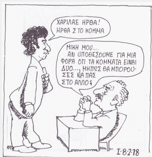
Σκίτσο του Γιάννη Ιωάννου στο ANTI

-Στις πρώτες μεταδικτατορικές εκλογές, το 1974 , η τηλεόραση τον παρουσιάζει να εκφωνεί λόγο ως υποψήφιος της Ενωμένης Αριστεράς στη Β' Πειραιώς. Ο ευφραδής Μίκης διαβάζει γραπτό κείμενο... Οι λεπτεπίλεπτες ισορροπίες του εκλογικού σχήματος, δεν σήκωναν νέες δοκιμασίες από ενδεχόμενες λεκτικές υπερβάσεις. Πρόσφατο ήταν το « Καραμανλής ή Τανκς ».