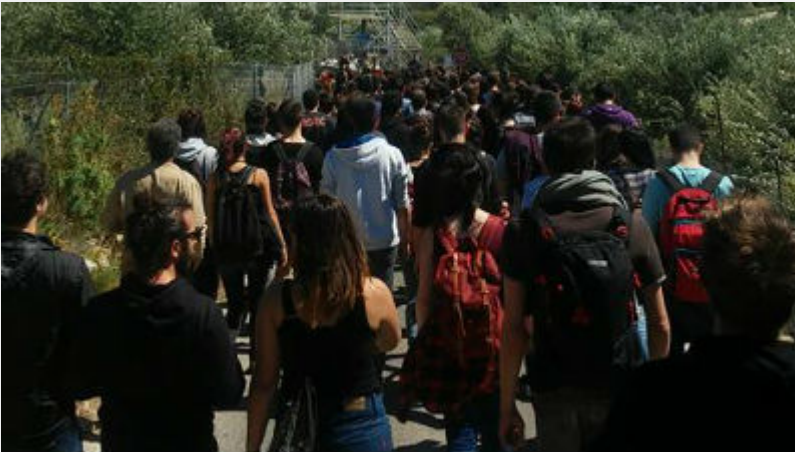
Κυριακή 10 Απρίλη: Σούδα