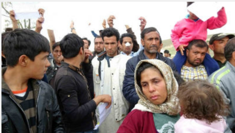
Κυριακή 10 Απρίλη: Κουστόχερο Θεσσαλίας