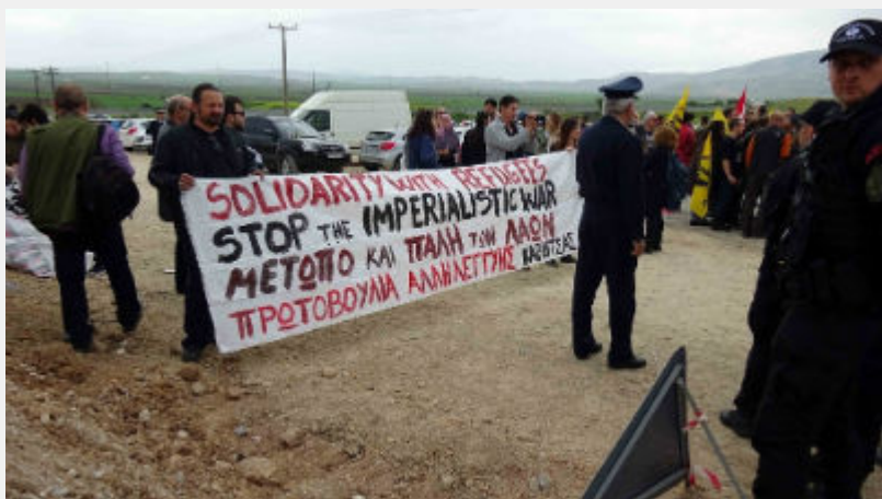
Κυριακή 10 Απρίλη: Κουστόχερο Θεσσαλίας