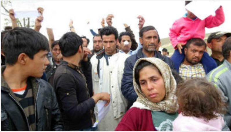
Κυριακή 10 Απρίλη: Κουστόχερο Θεσσαλίας