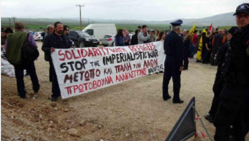
Κυριακή 10 Απρίλη: Κουστόχερο Θεσσαλίας