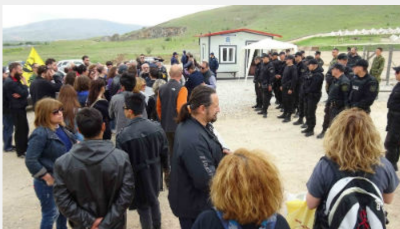
Κυριακή 10 Απρίλη: Κουστόχερο Θεσσαλίας