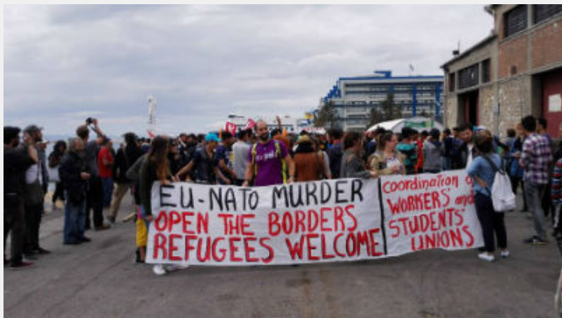
Κυριακή 10 Απρίλη: Πειραιάς