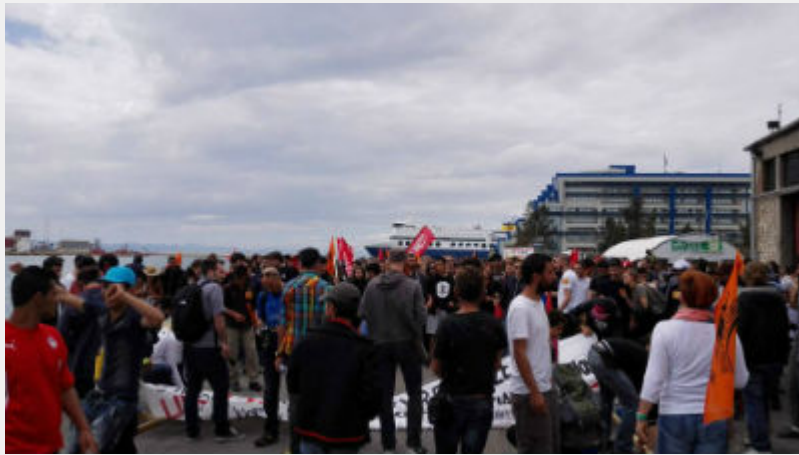
Κυριακή 10 Απρίλη: Πειραιάς