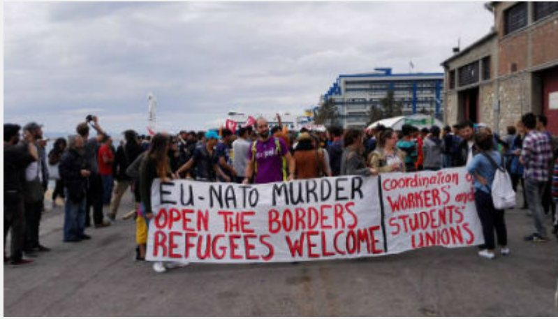
Κυριακή 10 Απρίλη: Πειραιάς