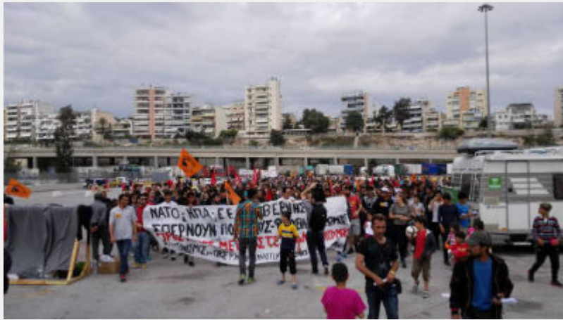
Κυριακή 10 Απρίλη: Πειραιάς