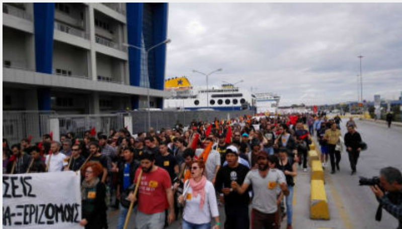
Κυριακή 10 Απρίλη: Πειραιάς