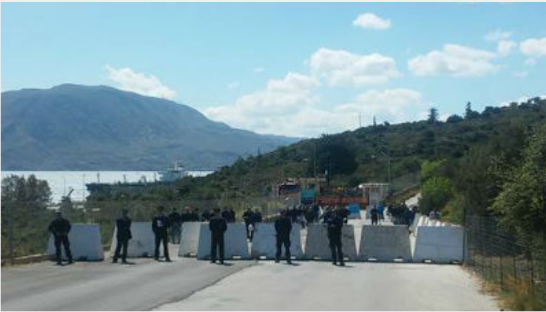
Κυριακή 10 Απρίλη: Σούδα