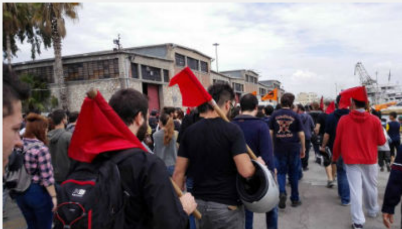
Κυριακή 10 Απρίλη: Πειραιάς