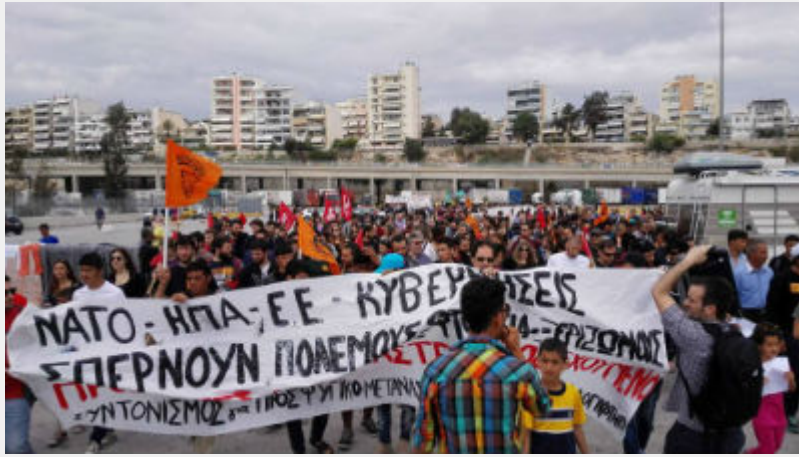
Κυριακή 10 Απρίλη: Πειραιάς