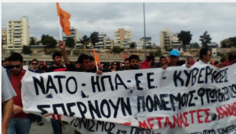
Κυριακή 10 Απρίλη: Πειραιάς