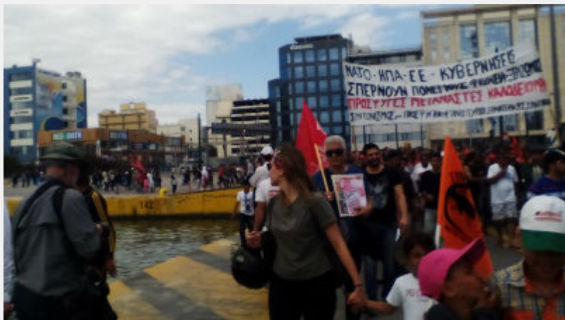
Κυριακή 10 Απρίλη: Πειραιάς