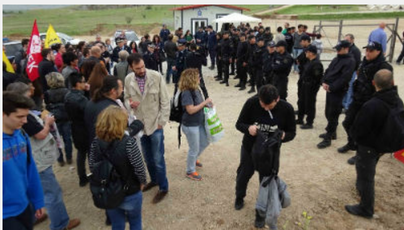
Κυριακή 10 Απρίλη: Κουστόχερο Θεσσαλίας