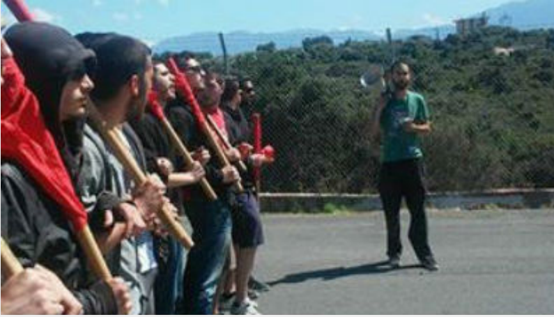
Κυριακή 10 Απρίλη: Σούδα