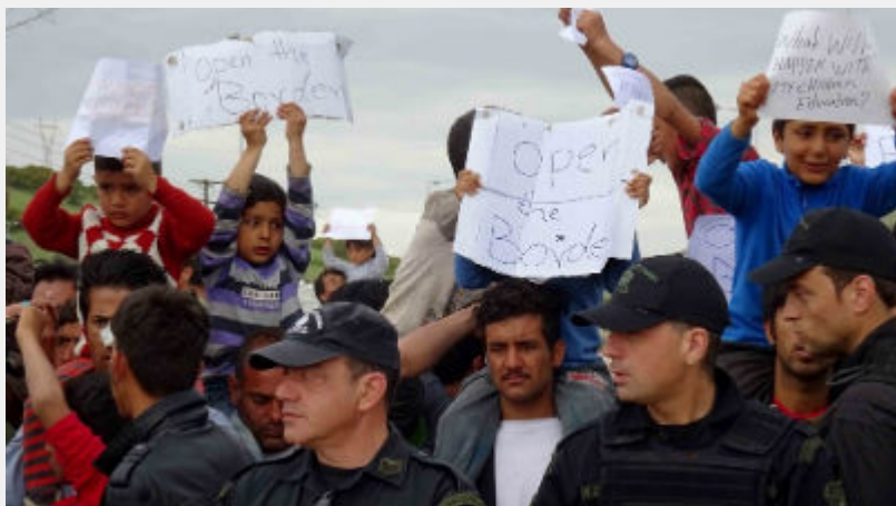
Κυριακή 10 Απρίλη: Κουστόχερο Θεσσαλίας