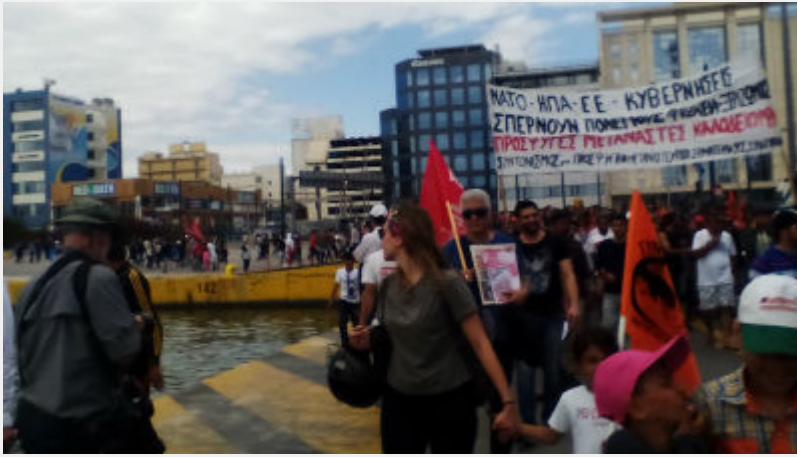
Κυριακή 10 Απρίλη: Πειραιάς