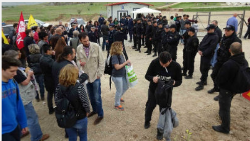
• Κυριακή 10 Απρίλη: Κουστόχερο Θεσσαλίας