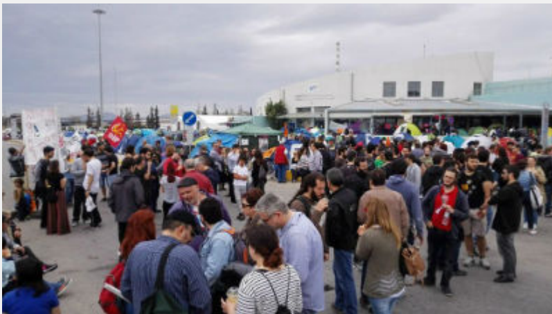
Κυριακή 10 Απρίλη: Πειραιάς