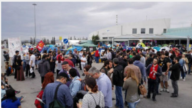
Κυριακή 10 Απρίλη: Πειραιάς