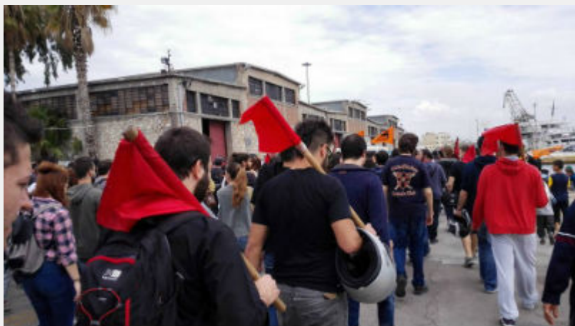
Κυριακή 10 Απρίλη: Πειραιάς