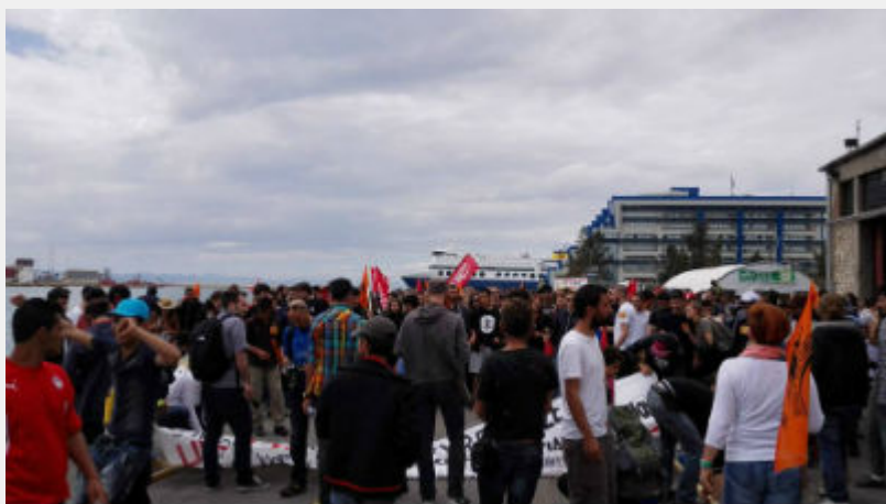
Κυριακή 10 Απρίλη: Πειραιάς