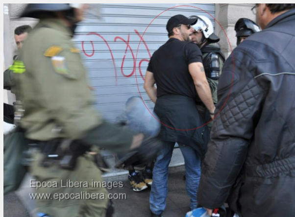
Πογκρόμ στην Αθηνάς.