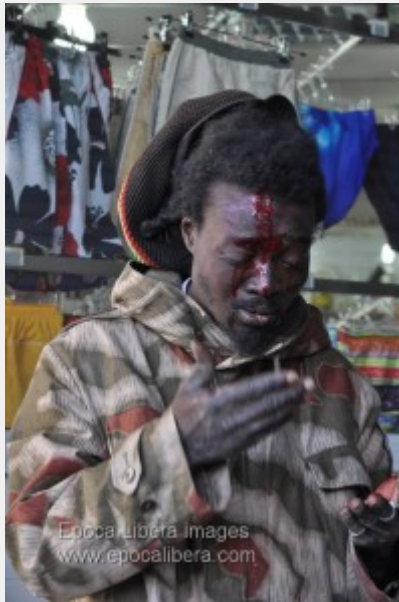
Ξυλοδαρμός αφρικανού μετανάστη