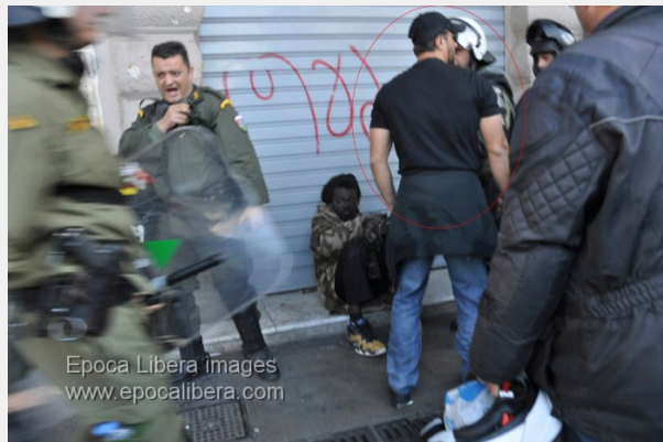
Πογκρόμ στην Αθηνάς.