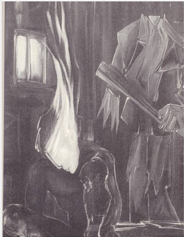
Έργο του Γιώργου Τσιριγώτη

Κι ακόμα μιλούσαν γι αυτόν στέρνες, πηγάδια και σχισμένοι βράχοι. Οι πέτρες των νησιών του Αιγαίου, νύχτες στοχαστικές κι η θάλασσα της Λέρου που ρυτίδιασε από τη φρίκη της