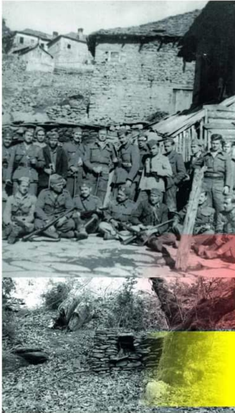
ΛΑΡΙΣΑ, Άνοιξη 2023