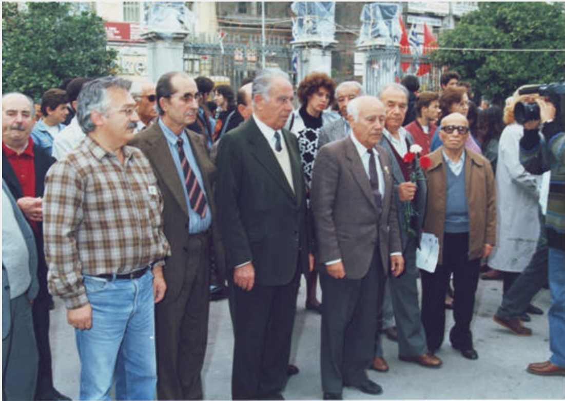
Με την επιτροπή για την υπεράσπιση της μνήμης και του έργου του Στάλιν, κατάθεση στεφάνου στο Πολυτεχνείο (πάνω), ομιλητής σε εκδήλωση (κάτω).