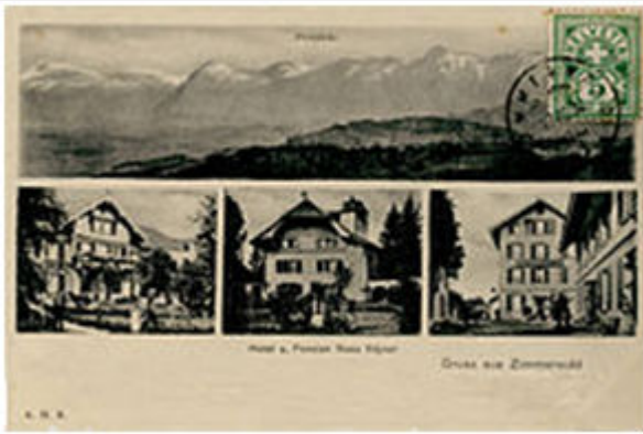
Καρτ-ποστάλ από το Τσίμμερβαλντ με διαφήμιση του ξενοδοχείου Beau Séjour όπου έλαβε χώρα η Διάσκεψη