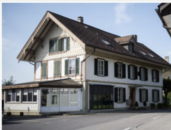
Το ξενοδοχείο Beau Séjour στη σημερινή του μορφή

Για τη σημερινή κομμουνιστική Αριστερά θα ήταν ασφαλώς πολύ χρήσιμο να βγάλει διδάγματα από την τότε τακτική του Lenin, για το πώς θα μπορούσε σήμερα να συνεισφέρει στη σύσφιξη των σχέσεων ανάμεσα στις μαρξιστικές δυνάμεις, να τις βαθαίνει και να τις ενισχύει -όχι μόνο διεθνώς!