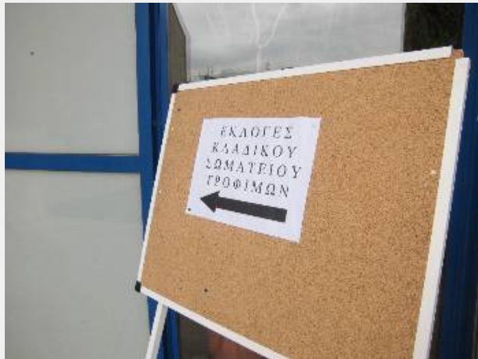
Το μοναδικό «έντυπο» που εξέδωσε το σωματείο... Δείχνει την αίθουσα που γίνονταν οι εκλογές

Το σωματείο αυτό δεν ξεχωρίζει εύκολα από το μηχανισμό της εργοδοσίας στον κλάδο. Με στελέχη που απολαμβάνουν παχυλούς μισθούς ως προϊστάμενοι και διευθυντές σε μεγάλα καταστήματα του κλάδου των Τροφίμων, τα αφεντικά εξασφαλίζουν ένα σωματείο του χεριού τους και ταυτόχρονα δεκάδες αντιπροσώπους στην Ομοσπονδία, στο Εργατικό Κέντρο Αθήνας και τη ΓΣΕΕ, προκειμένου να αλλοιώνουν προς όφελός τους τους συσχετισμούς.