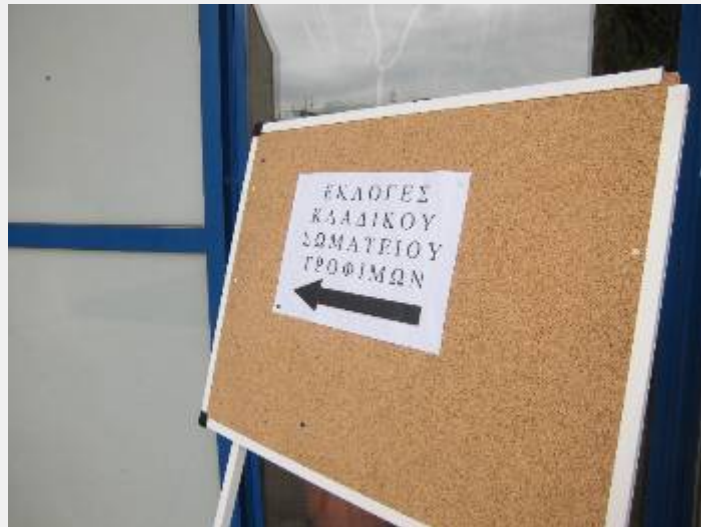
Το μοναδικό «έντυπο» που εξέδωσε το σωματείο... Δείχνει την αίθουσα που γίνονταν οι εκλογές

Το σωματείο αυτό δεν ξεχωρίζει εύκολα από το μηχανισμό της εργοδοσίας στον κλάδο. Με στελέχη που απολαμβάνουν παχυλούς μισθούς ως προϊστάμενοι και διευθυντές σε μεγάλα καταστήματα του κλάδου των Τροφίμων, τα αφεντικά εξασφαλίζουν ένα σωματείο του χεριού τους και ταυτόχρονα δεκάδες αντιπροσώπους στην Ομοσπονδία, στο Εργατικό Κέντρο Αθήνας και τη ΓΣΕΕ, προκειμένου να αλλοιώνουν προς όφελός τους τους συσχετισμούς.