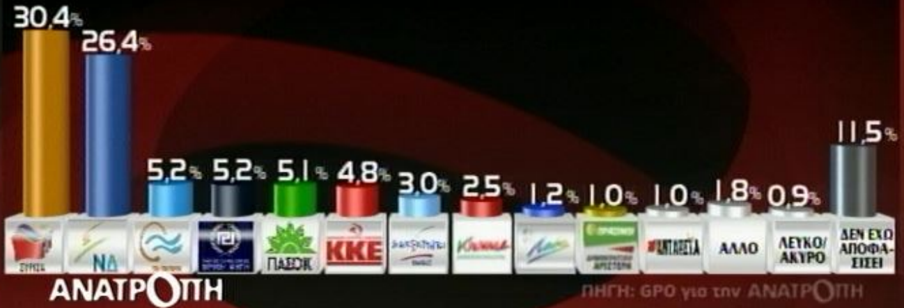
Δείτε απόσπασμα της πρόσφατης δημοσκόπησης της GPO που παρουσιάστηκε στην εκπομπή ΑΝΑΤΡΟΠΗ τη Δευτέρα 19/1/2015.

28,5% 25,3% 5,8% 5,4% 5,0% 5,7% 2,7% 2,6% 2,0% 1,0% 2,0% 0,9% 13,1%