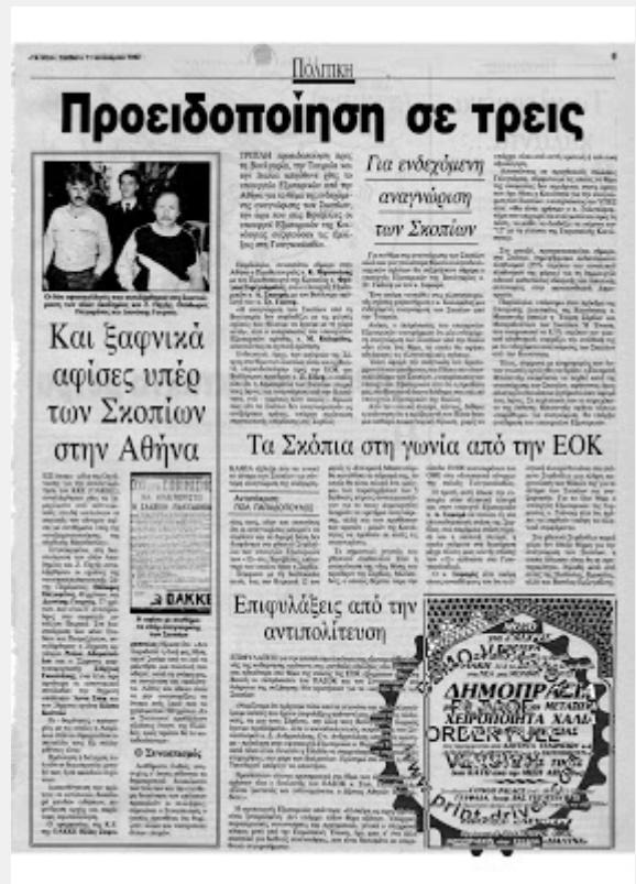
TA NEA, 11/1/1992

«Τα δύο μπλοκ των ληστών κυβέρνησης και αντιπολίτευσης... αυτοί που έχουν φερθεί με ψευτιά και θράσος απέναντι στον ελληνικό λαό, είναι εξίσου ψεύτες και θρασεείς στις διεθνείς τους σχέσεις. Σκύβουν το κεφάλι στους ισχυρούς και ποδοπατούν τους αδύναμους... Έλληνες πατριώτες, δημοκράτες... τσακίστε τους πολεμοκάπηλους των τριών κομμάτων».