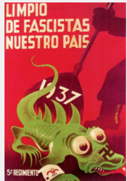
ΑΝΤΙΦΑΣΙΣΤΙΚΗ ΑΦΙΣΑ ΤΟΥ ΙΣΠΑΝΙΚΟΥ ΕΜΦΥΛΙΟΥ

Όμως, η ιδέα ότι στην μετάβαση προς την λαϊκή εξουσία δεν θα υπάρχουν καπιταλιστικές σχέσεις παραγωγής και καπιταλιστική ανάπτυξη είναι παράλογη. Θα ήταν ένας σκέτος αριστερισμός, αν δεν ήταν, ακόμη χειρότερα, μια ιδέα που πριμοδοτεί το μη σχέδιο -την αδράνεια- την ιδεολογική και κινηματική στασιμότητα, την άγωνα ταυτοτική περιχαράκωση. Ως τέτοια, είναι επικίνδυνη, όπως ακριβώς ήταν η συγκαλυπτική στάση του σταλινισμού, η οποία το 1936 κήρυξε τον «σοσιαλισμό» και την εξαφάνιση των ανταγωνιστικών αντιθέσεων, συγκαλύπτοντας την ταξική εξουσία της γραφειοκρατίας. Όποιος δεν παρουσιάζει καθαρά την κατάσταση, καταλήγει να ενισχύει, σε φάσεις όξυνσης της ταξικής πάλης, τελικά τον ταξικό αντίπαλο.