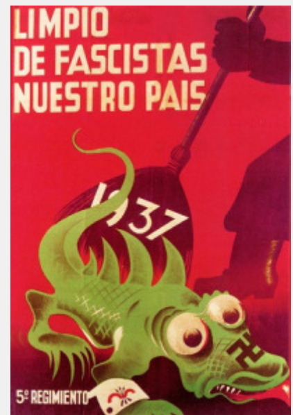
ΑΝΤΙΦΑΣΙΣΤΙΚΗ ΑΦΙΣΑ ΤΟΥ ΙΣΠΑΝΙΚΟΥ ΕΜΦΥΛΙΟΥ

Όμως, η ιδέα ότι στην μετάβαση προς την λαϊκή εξουσία δεν θα υπάρχουν καπιταλιστικές σχέσεις παραγωγής και καπιταλιστική ανάπτυξη είναι παράλογη. Θα ήταν ένας σκέτος αριστερισμός, αν δεν ήταν, ακόμη χειρότερα, μια ιδέα που πριμοδοτεί το μη σχέδιο -την αδράνεια- την ιδεολογική και κινηματική στασιμότητα, την άγωνα ταυτοτική περιχαράκωση. Ως τέτοια, είναι επικίνδυνη, όπως ακριβώς ήταν η συγκαλυπτική στάση του σταλινισμού, η οποία το 1936 κήρυξε τον «σοσιαλισμό» και την εξαφάνιση των ανταγωνιστικών αντιθέσεων, συγκαλύπτοντας την ταξική εξουσία της γραφειοκρατίας. Όποιος δεν παρουσιάζει καθαρά την κατάσταση, καταλήγει να ενισχύει, σε φάσεις όξυνσης της ταξικής πάλης, τελικά τον ταξικό αντίπαλο.